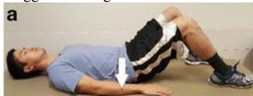
Gambar 1. Posisi pelvic tilting exercise

Pasien / peserta kegiatan PkM diminta memposisikan diri dengan posisi tidur terlentang. Posisikan tangan berada di samping pinggul dan kemudian tekuk bagian lutut. Tarik atau tekan bagian perut sehingga pinggul tertarik keatas, sementara itu posisikan punggung agar sepenuhnya menyentuh lantai. Gerakan ini dilakukan hingga 20 hitungan