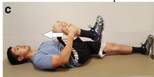
Gambar 3. Single knee to chest

Gerakan ketiga adalah single knee to chest. Masih dalam posisi tubuh tidur terlentang, tarik salah satu kaki (kaki kanan) hingga lutut dalam posisi menekuk. Upayakan posisi lutut mencapai atau mendekati area dada. Tahan posisi ini dalam 10 hitungan