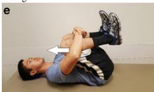
Gambar 4. Double knee to chest

Double knee to chest dilakukan dengan posisi tidur terlentang. Tekuk kedua lutut secara bersamaan, lalu tarik kedua lutut ke arah dada. Gunakan tangan anda untuk memeluk kedua lutut untuk menghasilkan tarikan maksimal, lalu tahan posisi tersebut selama 10 hitungan