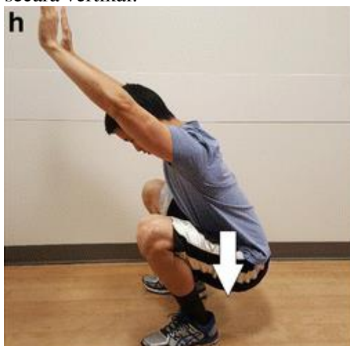
Gambar 10. Gerakan squat

dibusungkan. Setelah itu, berikan dorongan di tumit dan melompatlah secara vertikal.