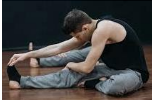
Gambar 8. Hamstring stretch dalam posisi duduk

Hamstring stretch dalam posisi duduk dilakukan dengan meluruskan salah satu kaki dan satu kaki ditekuk seperti posisi duduk bersila. Tarik ujung jari kaki menggunakan bantuan jari tangan hingga pada paha bawah terasa tertarik. Lakukan selama 10 hitungan. Selanjutnya lakukan gerakan yang sama untuk kaki sebelahnya. Masing-masing gerakan dilakukan dalam 10 hitungan