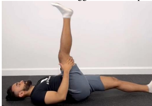
Gambar 5. Hamstring stretch

Latihan dilakukan dengan tidur terlentang dan salah satu lutut ditekuk dan lutut lainnya diluruskan. Angkat sisi kaki yang lurus ke atas dan rasakan hingga ada tarikan pada bagian paha belakang.