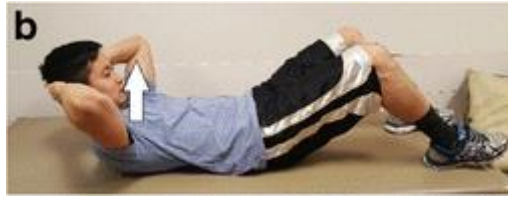
Gambar 2. Posisi partial sit-up

Saat melakukan gerakan ini, lutut harus ditekuk dan telapak kaki menempel di lantai. Jangan mengangkat kepala dengan tangan dan hanya cukup mengangkat tulang belikat saja. Gerakan ini dilakukan hingga 20 hitungan