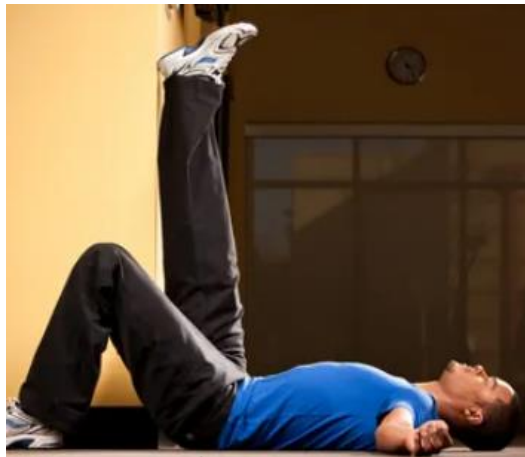
Gambar 6. Hamstring stretch dengan meletakkan kaki pada tembok

Beberapa orang mungkin mengalami kesulitan untuk melakukan gerakan ini. Untuk membantu melakukan gerakan hamstring stretch, dapat dilakukan dengan meletakkan salah satu kaki pada tembok atau kursi