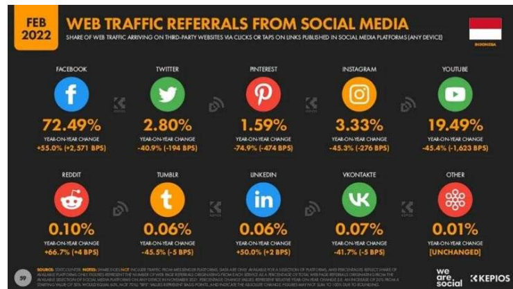
Gambar 3. Data Pengguna Media sosial traffic Indonesia