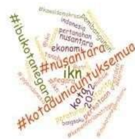
Gambar 4. Data opini publik terkait proses perencanaan pemindahan IKN melalui pencarian #KotaDuniauntukSemua pada akun twitter yang di dapat dari aplikasi Nvivo 12 Plus