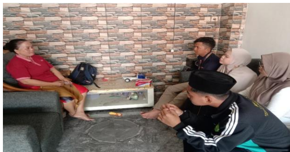
Gambar 1 Rangkaian Survei

Secara garis besar, kegiatan ini mengindikasikan bahwa dengan pendekatan yang tepat, yakni yang sangat praktis, visual, dan personal, pelatihan mengenai literasi keuangan dan pemasaran digital dapat diterima dan dilaksanakan dengan efektif oleh pelaku UMKM konveksi yang memiliki latar belakang pendidikan formal terbatas. Antusiasme peserta menjadi indikator awal keberhasilan dalam transfer pengetahuan dan keterampilan penting untuk pengembangan usaha mereka. Rincian Kegiatan pengabdian dapat dilihat pada gambar 1, dan gambar 2 yang kami lakukan.