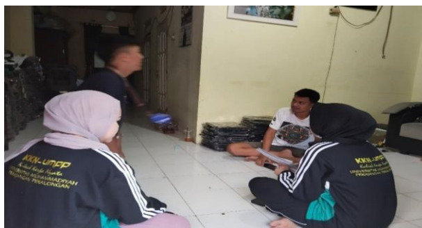
Gambar 2 Rangkaian Evaluasi