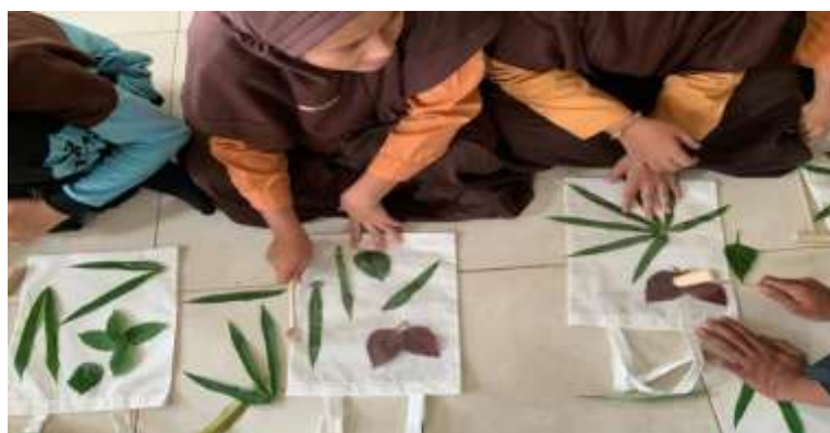
Gambar 2. Sesi Pelatihan Ecoprint pada Siswa

Pada proses pembuatan ecoprint ini dipandu oleh seluruh panitia, dimana siswa diberikan bahan-bahan alami berupa daun untuk diaplikasikan ke permukaan kain sehingga menghasilkan motif dan warna yang beragam menjadikan totebag yang indah dan ramah lingkungan.