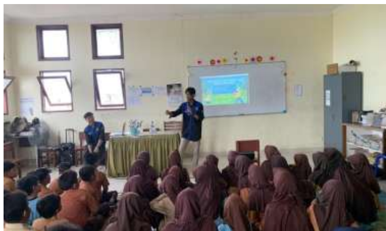
Gambar 1: Sesi Memaparkan Materi Pada Siswa SDN 01 Percontohan Aceh Barat

kegiatan baik langsung atau tidak langsung dengan mengaitkan sumber rujukan yang relevan, dokumentasi yang relevan dengan menyajikan foto, tabel, grafik, bagan atau gambar, keunggulan dan kelemahan luaran, serta tingkat kesulitan pelaksanaan kegiatan.