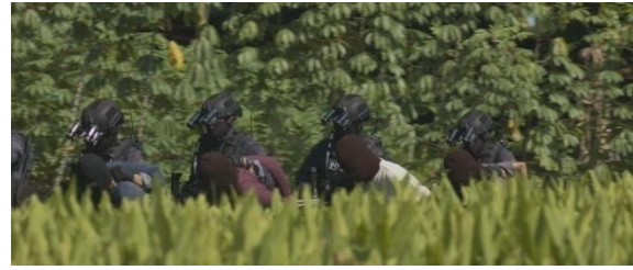
Gambar 5.6: Para tersangka terorisme yang ditangkap oleh unit konter terorisme (Panji, Paramita, ibid)

Dalam film ini ditampilkan bagaimana para pelakuterorisme yang bersembunyi di desa-desa ditangkap oleh pihak Kepolisian Republik Indonesia. Tidak ada tempat yang aman bagi mereka untuk bersembunyi sehingga film ini juga menampilkan aksi konter terorisme dimana para terorisme ditangkap untuk mencegah mereka melakukan aksi terorisme.