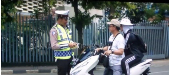
Gambar: Cameo dari Kapolri Jenderal Tito Karnavian. (Panji, Paramita, ibid)

penting berkendara dengan segala perlengkapannya dan mentaati segala peraturan lalu lintas. Dalam film ini menjadi hiburan tersendiri karena Jenderal Tito Karnavian tampil layaknya masyarakat umum.