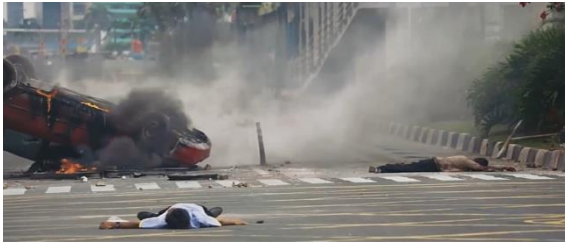
Gambar: Situasi tidak aman yang disebabkan oleh terorisme (Panji, Paramita, ibid)