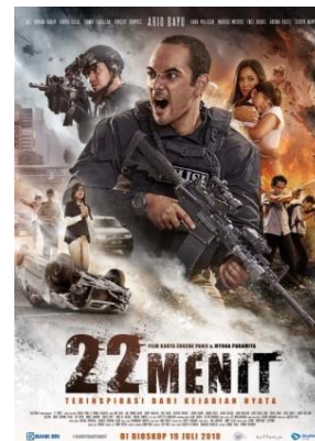
Gambar: 22 Menit

Film 22 Menit adalah film yang menggambarkan kisah nyata ancaman terorisme sehingga dapat dikategorikan sebagai film yang bertemakan pertahanan dan masuk ketegori sebagai film yang berfungsi untuk mendukung pertahanan negara, baca Motion Picture (Film) As Media for Supporting State Defense (Tobing, 2016).