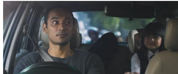
Gambar: Karakter personil Kepolisian Republik Indonesia yang terpuji (Panji, Paramita, ibid)

karakter personil kepolisian yang memiliki karakter terpuji. Hal ini ditampilkan sebagai pribadi yang memperhatikan keluarganya dengan baik seperti menyayangi anak dan istri.