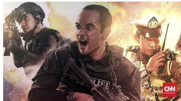
Gambar: Film 22 Menit (Andika Putra, 2018)

dengan Kepolisian Republik Indonesia (Polri) (Ramadhani, 2018)