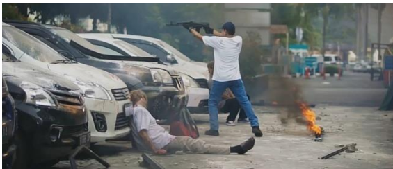
Gambar: Para terorisme yang menjaditokohjahatdalam film 22 Menit (Panji, Paramita, ibid)

Film ini menampilkan peran polisi dalam posisi pihak yang baik dan teroris sebagai penjahat. Di film ini ditampilkan bagaimana para pelaku teroris tidak peduli pada korban jiwa yang ada dan terus melakukan penembakan ke arah polisi demi melanjutkan aksi terornya.