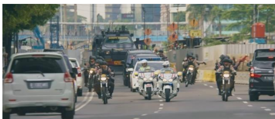
Gambar: Kepolisian Republik Indonesia yang modern (Panji, Paramita, 2018)

Didalam film ini diperlihatkan perkembangan terkini dari Kepolisian Republik Indonesia. Peralatan yang terbaru seperti senjata, kendaraan, dan perlengkapan lainnya. Selain itu diperlihatkan juga koordinasi yang terstruktur dalam penanggulangan aksi terorisme.