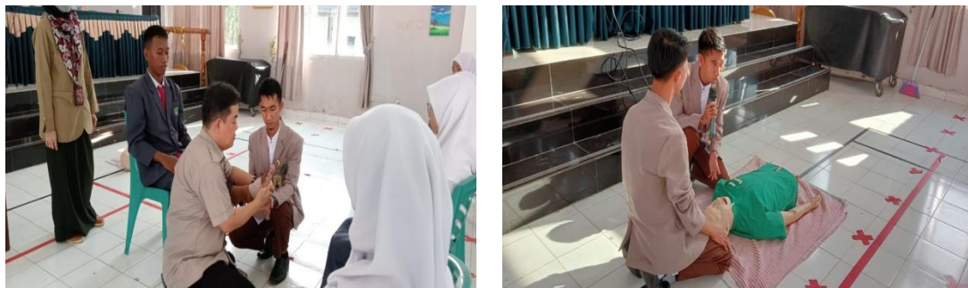
(a) (b) Gambar 2. Demonstrasi (a) Pembidaian (b) RJP