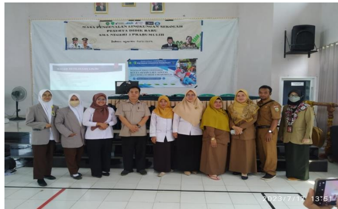
Gambar 1. Foto tim Pengabdian Masyarakat

Bila membandingkan dengan penilaian pengetahuan siswa SMAN 3 Kota Prabumulih setelah diberikan pelatihan gawat darurat yang menunjukkan perbedaan yang cukup signifikan dengan sebelum diberikan pelatihan maka menurut Supriyanto, 2016 mengatakan bahwa dalam penguasaan keterampilan seseorang dipengaruhi oleh pengetahuan, pengalaman, dan keinginan atau motivasi. Tentu saja siswa SMAN 3 Kota Prabumulih memerlukan lebih banyak lagi pengalaman selain keinginan yang kuat untuk belajar dan motivasi dari orang tua, guru, teman dan tentu saja semua pihak yang peduli dengan dengan generasi muda, generasi penerus bangsa ini.