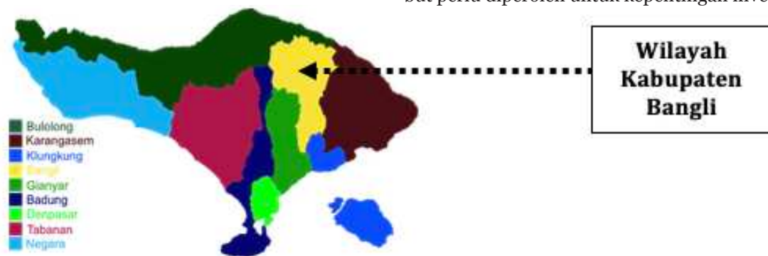
Gambar 1. Posisi Kabupaten Bangli pada Peta Pulau Bali.

Kabupaten Bangli yang merupakan bagian dari wilayah Provinsi Bali (Gambar 1), memiliki empat kecamatan yang salah satunya adalah Kecamatan Susut (Gambar 2). Memiliki luas wilayah 49,31 km 2 , berada di ketinggian 650 meter dari permukaan laut. Luas wilayah tersebut, telah dimanfaatkan untuk kepentingan pertanian seluas 1240, 50 hektar (25,16 %) dan tegalan 1449, 72 hektar (59,42 %) serta pekarangan 301,83 hektar (6,12 %) termasuk kegiatan lainnya seluas 436,62 hektar (9,30 %). Kecamatan Susut Kabupaten Bangli Provinsi Bali menaungi sembilan Desa, 50 Desa Adat (Desa Pekraman) dan 54 Banjar Dinas (Dusun). Jumlah penduduknya 44.680 jiwa, yang terdiri atas laki-laki 22.104 orang dan perempuan 22.576 orang serta sebanyak 4.852 jiwa memiliki kegiatan bertani. Mayoritas penduduk di Kecamatan Susut sedang berada dalam batas usia yang produktif, yaitu 15 – 45 tahun. Sebagai salah satu sumber daya dalam konteks pembangunan, maka penduduk Kecamatan Susut (Gambar 3) telah mengikuti kegiatan pembinaan dan pembangunan di bidang kependudukan agar dapat tercipta kondisi masyarakat yang mandiri dan sejahtera (Kecamatan Susut, 2019 dan BPS Kabupaten Bangli, 2019).