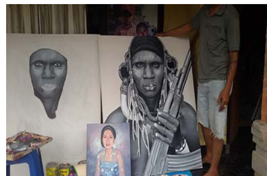
Gambar 18. Salah satu karya I Nengah Pujana.