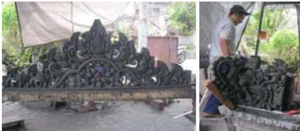
Gambar 24. Ukiran pasir melela karya I Ketut Sila.