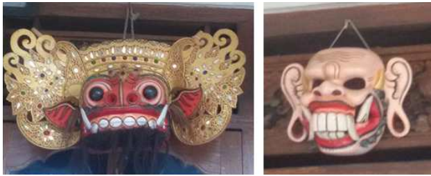
Gambar 4. Produk topeng karya I Nengah Sayang.