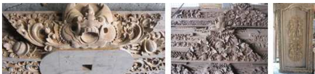
Gambar 5. Produk ukiran karya I Wayan Sudana