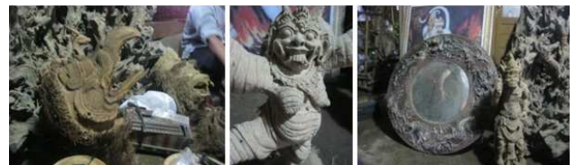
Gambar 19. Sejumlah karya ciptaan I Kadek Sudanco yang berbahan akar bambu.