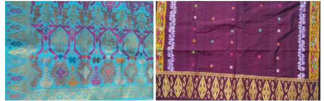
Gambar 17. Contoh tenun cagcag warga Desa Sidemen.