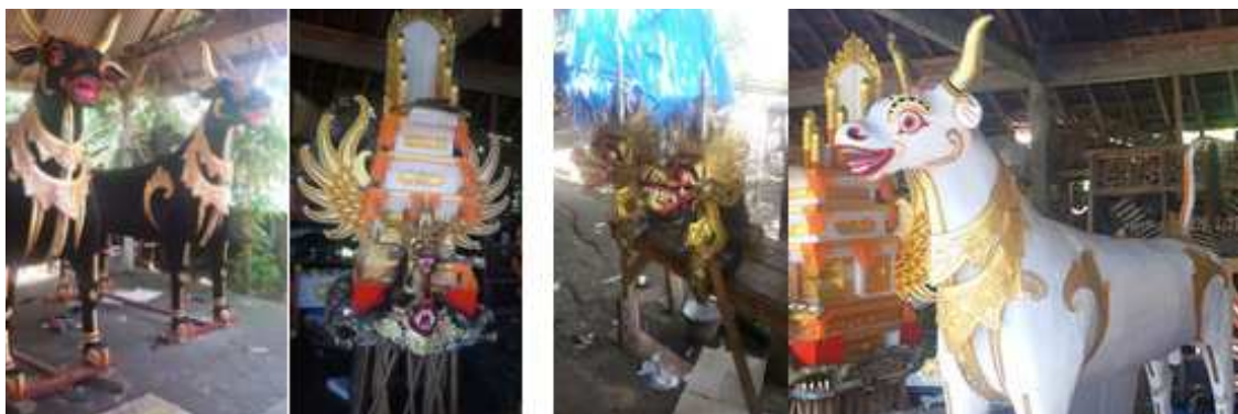
Gambar 8. Produk bade karya I Ketut Tantri (kiri) dan Jro Mangku Yadnya (kanan)

upacara tiga bulanan dan sekarang bahkan dipakai sebagai aksesoris di dalam suatu ruangan. Bahan bakunya berupa anyaman bambu, tetapi dikombinasi juga dengan bahan lainnya yang sejenis seperti rotan. Beberapa warga yang berdomisili di Kecamatan Susut Kabupaten Bangli mengerjakan jenis produk ini adalah I Nyoman Terima di Banjar Temaga Desa Tiga (Gambar 13).