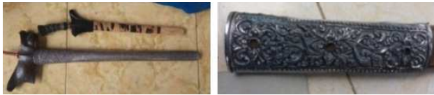
Gambar 9. Produk sarung keris karya I Ketut Rena