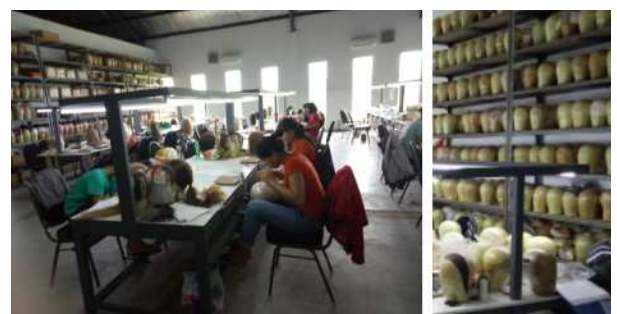
Gambar 20. Workshop dan produk wig yang dihasilkan.