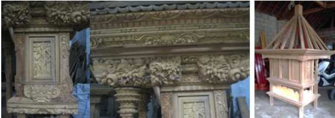
Gambar 7. Produk sanggah karya Gusti Pekak Polos (kiri) dan I Gusti Ketut Konje (kanan)