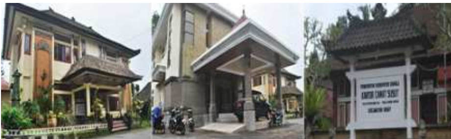
Gambar 3. Tampilan Kantor Camat Susut di Kabupaten Bangli