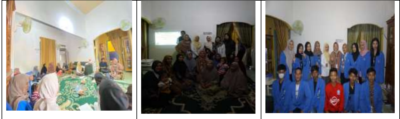
Gambar 3 : Pelaksanaan PKM