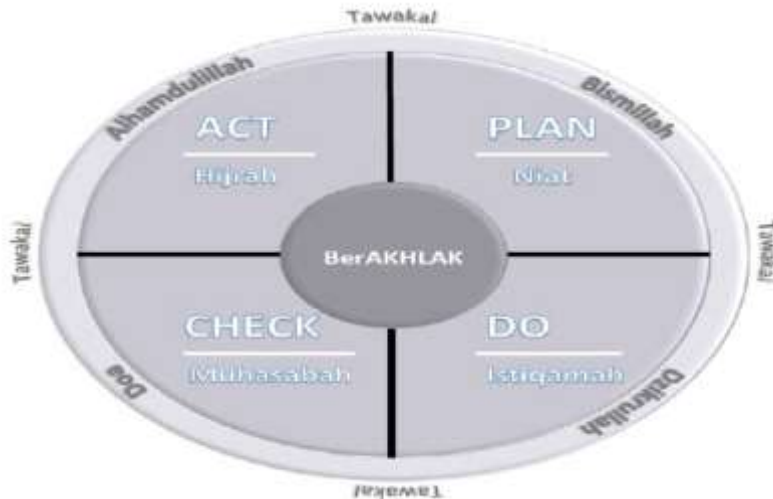
Gambar 1. Tahapan Perencanaan Keuangan Keluarga (PDCA/NIMH)

Perencanaan keuangan keluarga yang “SAKINAH” akan tercapai jika masing-masing anggota keluarga mampu menjalankan prinsip dan tahapan perencanaan keuangan dengan baik. Setiap anggota keluarga memiliki peran dan fungsinya masing-masing. Pada intinya adalah setiap anggota keluarga hendaknya memainkan perannya dengan penuh tanggungjawab sesuai dengan kesepakatan keluarga yang tentunya berkesesuaian dengan prinsip-prinsip syariah yang Allah tetapkan. Anggota keluarga hendaknya mampu mengharmoniskan hubungan antara insan di dalamnya serta senantiasa ikhtiar ”menghadirkan Allah” dalam keluarganya tentu akan dengan mudah menjalankan perannya masing-masing dalam keuangan keluarga. Hubungan ini dapat tergambar dalam gambar 2.