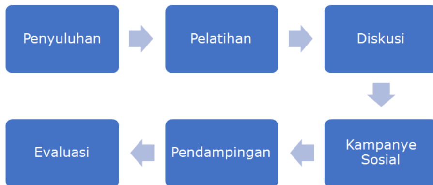
Gambar 1. Tahapan Sosialisasi Pemilihan Kepala Daerah

Berikut adalah beberapa tahapan umum dalam sosialisasi pemilihan kepala daerah: