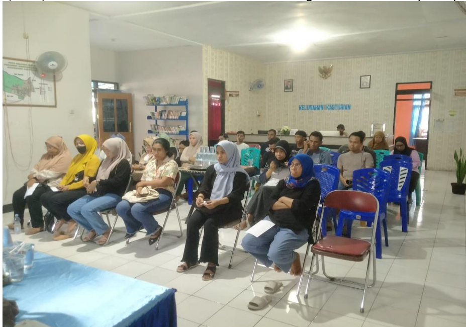
Gambar 2. Dokumentasi Bimbingan Teknis Kegiatan Pemilihan Kepala Daerah

Melalui kegiatan Bimtek ini, diharapkan semua pihak yang terlibat dalam pemilihan kepala daerah memiliki pemahaman yang cukup dan keterampilan yang diperlukan untuk melaksanakan tugas mereka dengan baik, sehingga memastikan bahwa pemilihan berjalan dengan lancar, adil, dan demokratis. Foto dokumentasi kegiatan bimtek seperti pada gambar 2.