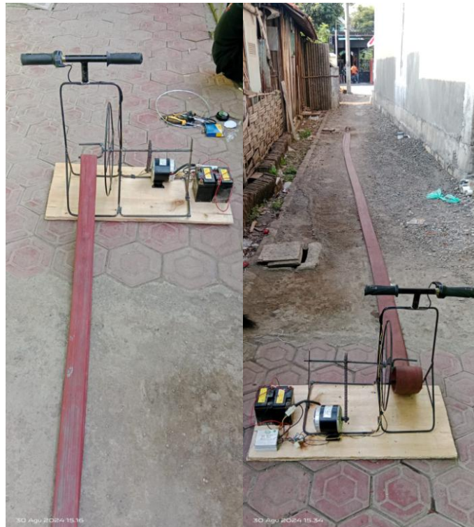
Gambar 5. Rancangan Motor