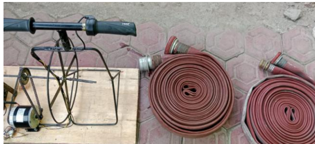
Gambar 3. Alat

Peningkatan waktu penggulangan dalam kondisi beban menunjukkan bahwa meskipun motor BLDC meningkatkan efisiensi dalam kondisi tanpa beban, perlu adanya optimasi lebih lanjut untuk menghadapi beban tambahan. Faktor-faktor seperti torsi motor, kemampuan pengendalian beban, dan pengaturan sistem kontrol mungkin perlu diperhatikan untuk meningkatkan performa alat dalam kondisi beban berat.