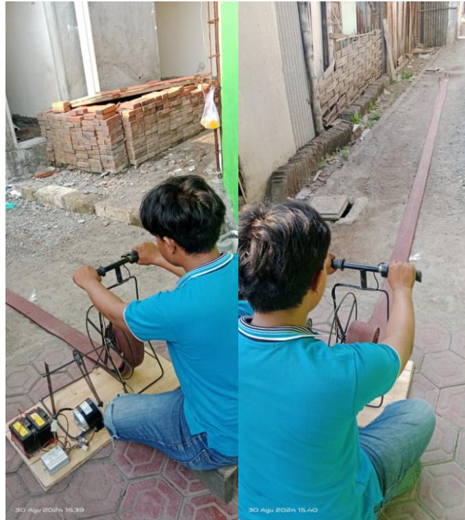
Gambar 4. Simulasi Penggulungan