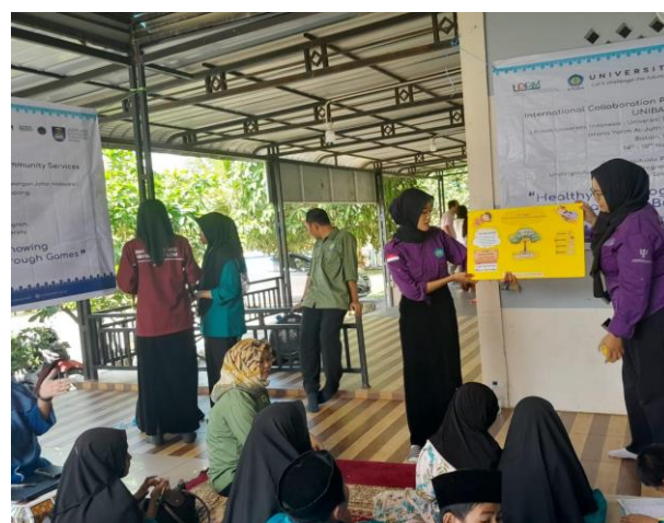
Gambar 3. Kegiatan sosialisasi mengenai cita-cita

Kelebihan diri adalah kualitas atau kemampuan unik yang dimiliki seseorang. Ini bisa berupa bakat, keterampilan, atau karakteristik pribadi. Kelebihan diri ini dapat digunakan sebagai potensi untuk mencapai cita-cita di masa depan. Misalnya, seorang anak yang memiliki kelebihan dalam matematika mungkin memiliki cita-cita untuk menjadi seorang insinyur atau ilmuwan.