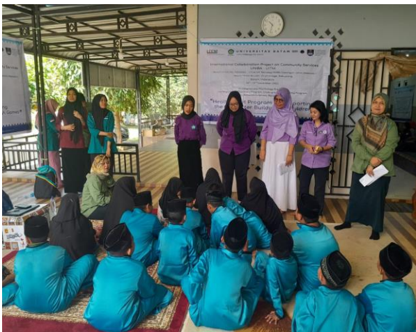
Gambar 1. Kegiatan sharing session

Tahap awal kegiatan ini difokuskan pada refleksi dari bagian self-efficacy atau efikasi diri. Efikasi diri adalah keyakinan seseorang tentang kemampuannya untuk mencapai hasil tertentu. Ini adalah elemen penting dalam motivasi dan prestasi akademik. Dalam konteks ini, tim melakukan sharing session tentang kehidupan akademik anak-anak (Gambar 1).