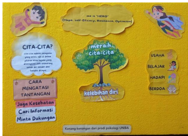
Gambar 2. Materi tentang cita-cita

Tim menggunakan analogi pohon untuk menjelaskan konsep cita-cita kepada anak-anak. Dalam analogi ini, cita-cita diibaratkan sebagai pohon, dan kelebihan diri sebagai akar pohon tersebut. Akar adalah bagian pohon yang memberikan nutrisi dan dukungan, mirip dengan bagaimana kelebihan diri dapat mendukung pencapaian cita-cita (Gambar 2).