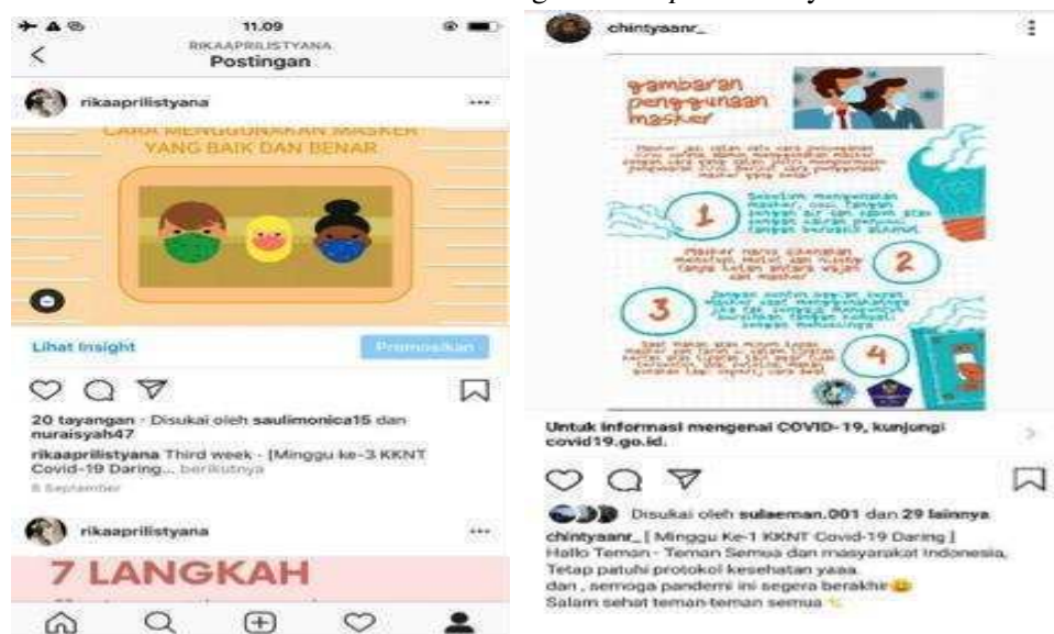
Gambar 3. Video dan Poster penggunaan masker yang dibagikan ke media sosial (minggu pertama)

Melalui dua informasi yang disampaikan di minggu pertama, diharapkan masyarakat dapat mengetahui bagaimana karakteristik virus corona, cara penularan serta bagaimana pencegahan yang diupayakan melalui penggunaan masker yang baik dan benar. Nampak antusias masyarakat melalui pemberian informasi ini. Kurang dari satu hari setelah penyebaran poster dan video, informasi tersebut telah dilihat oleh > 200 orang dan di repost sebanyak 10 kali.