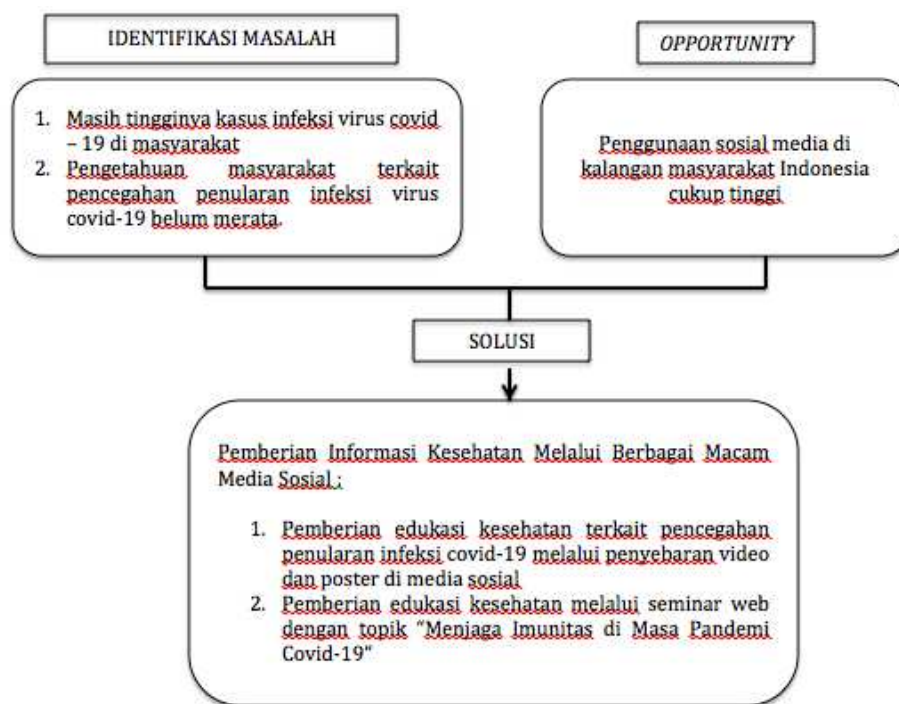
Bagan 1. Identifikasi masalah dan penentuan solusi

Pengabdian kepada masyarakat ini diselenggarakan secara daring. Penentuan solusi didasarkan pada kebutuhan yang mengacu pada permasalahan yang ditemukan, yang mana tercermin pada bagan di bawah ini :