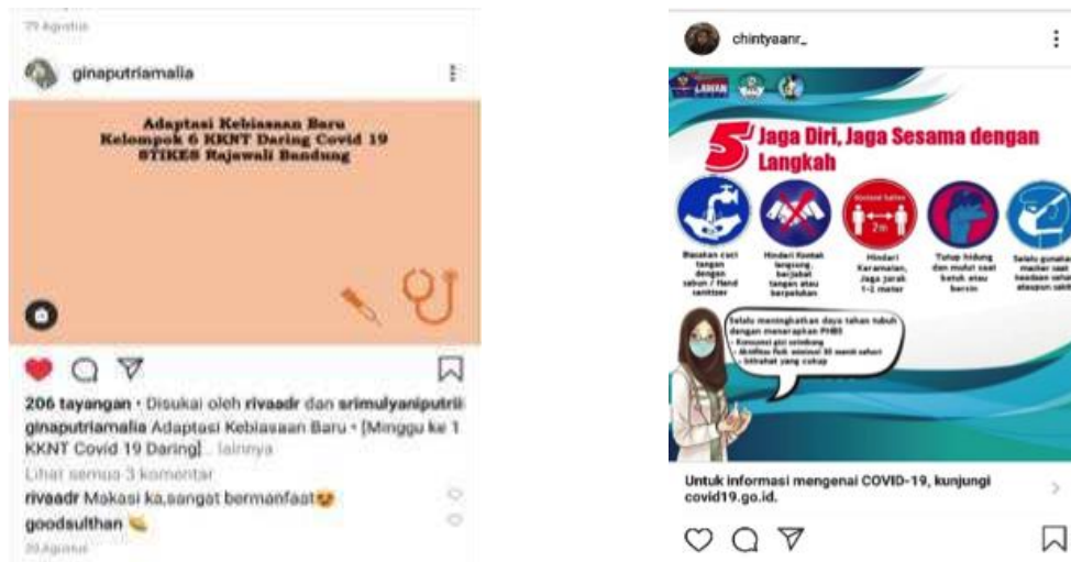
Gambar 2. Video dan Poster yang dibagikan ke media sosial (minggu pertama)

Selain informasi seputar corona virus, pada minggu ini juga disampaikan tentang cara penggunaan masker tepat fungsi. Informasi ini diberikan dengan tujuan mencegah penularan yang mungkin terjadi melalui droplet (saat batuk atau bersin dengan jarak yang cukup dekat). Melalui pemakaian masker yang tepat fungsi, diharapkan dapat melindungi orang yang sehat (dipakai untuk melindungi diri sendiri saat berkontak dengan orang yang terinfeksi) atau untuk mengendalikan sumber (dipakai oleh orang yang terinfeksi untuk mencegah penularan lebih lanjut). [13] Anjuran WHO kepada masyarakat umum agar memakai masker non-medis di dalam ruangan (misal saat ada di tempat kerja bersama, sekolah, toko dll) atau saat di luar ruangan yang mana penjagaan jarak minimal 1 meter sulit untuk dilakukan. [14]