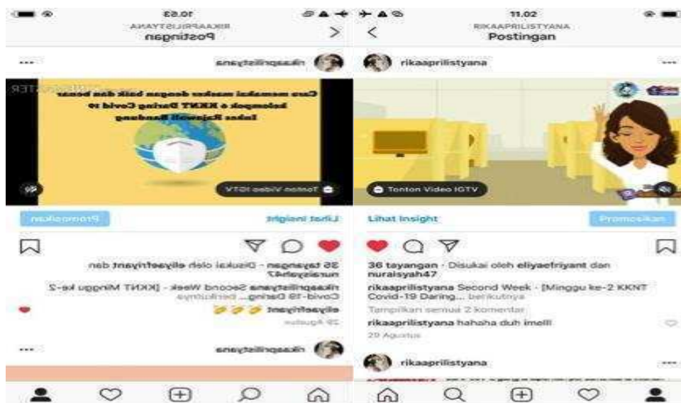
Gambar 4. Video dan Poster etika batuk dan informasi Covid-19 yang dibagikan ke media sosial (minggu kedua)

Minggu Ketiga : Kegiatan pengabdian kepada masyarakat di minggu ini dilaksanakan melalui seminar web dengan tema Menjaga imunitas di masa pandemi Covid-19 . Penyebaran informasi kesehatan melalui seminar web ini dilakukan untuk menarik minat masyarakat lebih banyak. Masyarakat tidak dibebankan pembayaran untuk mengikuti kegiatan seminar web ini. Topik yang diangkat dalam kegiatan ini seputar peningkatan imunitas yang lebih difokuskan pada pemenuhan gizi seimbang serta pengelolaan istirahat dan aktifitas di masa pandemi Covid-19 . Kegiatan seminar web ini dilaksanakan melalui zoom meeting yang secara bersamaan disiarkan langsung melalui youtube channel Institut Kesehatan Rajawali. Kegiatan diikuti oleh lebih dari 900 orang pendaftar. Saat penyelenggaraan kegiatan, seminar web ini disaksikan oleh lebih dari 5.000 masyarakat melalui live streaming youtube .