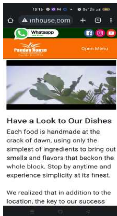
Gambar 2. Tampilan Responsive Website pandanhouse.com

Tahap coding untuk membuat tampilan pada website pada tahap coding ini menggunakan HTML, CSS, Framework CSS Bootstrap 5.0 . HTML digunakan untuk membuat desain pada website setelah desain dibuat lalu ditata dan dipercantik dengan menggunakan CSS agar website lebih rapih,nyaman, dan user-friendly dipandang,agar website bisa digunakan pada perangkat mobile penulis menggunakan Framework Bootstrap 5.0 untuk membuat website menjadi responsive dengan memanfaatkan grid yang sudah disediakan pada Bootstrap dan menggunakan Framework PHP Codeigniter 4.0 .