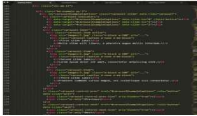
Gambar 3. Coding