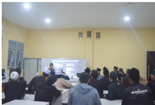
Gambar 2. Pemaparan Materi Fotografi

Pada tahap ceramah interaktif, siswa tampak mulai memahami pentingnya komunikasi visual dalam kehidupan sehari-hari. Pemahaman ini diperkuat melalui pengenalan elemen dasar fotografi dan prinsip desain visual. Dengan cara ini, siswa mulai membangun kesadaran akan bagaimana sebuah gambar bisa menjadi media penyampaian pesan yang efektif dan bernilai edukatif. Hal ini sejalan dengan pandangan bahwa fotografi dalam desain komunikasi visual memiliki kekuatan menyampaikan makna secara cepat dan mendalam.