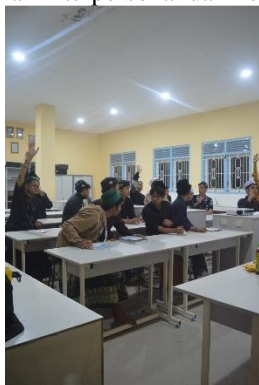
Gambar 1. Antusiasme peserta pelatihan saat diskusi reflektif

Setiap peserta pelatihan menyampaikan hasil karya dan mendapatkan tanggapan dari teman-teman serta mentor. Pembicaraan ini mengajak siswa untuk merenungkan proses kreatif yang dijalani, belajar menghargai sudut pandang orang lain, serta melatih keberanian dan keterbukaan terhadap saran [4][9]. Kegiatan ini sangat penting dalam pengembangan keterampilan interpersonal dan komunikasi visual yang efektif [8].