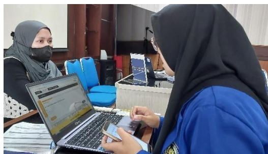
Gambar 2. Asistensi SPT Tahunan oleh Relawan Pajak

Asistensi Pelaporan Pajak Menggunakan DJP Online dan E-Filing Deskripsi: Kegiatan kedua adalah saat relawan pajak melakukan asistensi pelaporan pajak menggunakan website DJP Online dengan metode E-Filing. Dalam proses ini, wajib pajak wajib memiliki bukti potong pajak sebelum melakukan pelaporan. Relawan pajak membantu wajib pajak dalam mengunggah bukti potong dan mengisi formulir SPT 1770 SS maupun 1770 S dengan benar. Dengan adanya pendampingan ini, wajib pajak dapat lebih mudah memahami proses pelaporan secara elektronik dan mengurangi risiko kesalahan dalam pengisian data pajak mereka.