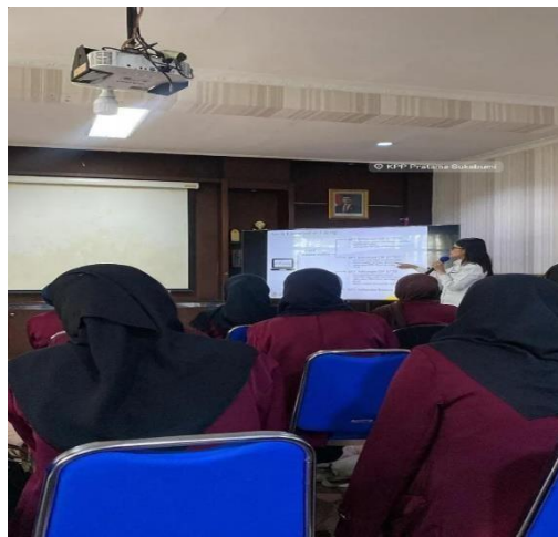
Gambar 1. Sosialisasi Relawan Pajak

Pada kegiatan pertama, staf dari KPP Pratama Sukabumi mengadakan sesi sosialisasi khusus untuk relawan pajak yang baru bergabung. Sosialisasi ini bertujuan untuk memberikan pemahaman yang mendalam mengenai tugas relawan pajak dalam mendampingi wajib pajak yang akan melaporkan SPT (Surat Pemberitahuan Tahunan). Para relawan diajak untuk memahami bagaimana cara menggunakan e-filing, serta diperkenalkan dengan prosedur yang berlaku di KPP Pratama Sukabumi. Staf KPP memberikan penjelasan tentang langkah-langkah pelaporan SPT dan bagaimana relawan pajak dapat membantu wajib pajak, baik yang melaporkan dengan formulir 1770 SS maupun 1770 S.