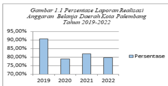
Gambar 1 Persentase laporan Realisasi Anggaran Belanja Daerah Kota Palembang Tahun 2019-2022

Dapat dilihat pada gambar diatas bahwa dalam periode 4 tahun terakhir memperlihatkan persentase penyerapan anggaran naik turun, hanya 2019 persentase penyerapan dapat dikatakan optimal. Ditemukan sebagian aspek yang berdampak terhadap penyerapan anggaran seperti Perencanaan anggaran yang dapat diartikan sebagai suatu rancangan awal dengan tujuan pengendalian dan penentuan arah yang akan dilewati oleh suatu organisasi. Perencanaan anggaran yang telah dilaksanakan secara optimal belum tentu menjadi standar bahwa pelaksanaan anggaran akan berjalan dengan efektif pula. Pelaksanaan anggaran merupakan tahapan sumber daya yang digunakan untuk melaksanakan prosedur anggaran yang telah dibuat. Selain perencanaan dan pelaksanaan, aspek yang berpengaruh terhadap penyerapan anggaran adalah regulasi, Regulasi berguna untuk merealisasikan prosedur organisasi untuk menghadapi timbulnya suatu permasalahan. Namun karena banyaknya regulasi sementara periode tidak mumpuni, menyebabkan pelaksanaan anggaran mengalami hambatan dalam penerapannya. Faktor berikutnya yang mempengaruhi penyerapan anggaran yaitu komitmen organisasi, komitmen organisasi merupakan sikap kepatuhan pegawai dalam memihak dan ikut serta di suatu organisasi tertentu yang mempunyai tujuan untuk mengayomi anggotanya. Dari hasil penjelasan sebelumnya, maka peneliti