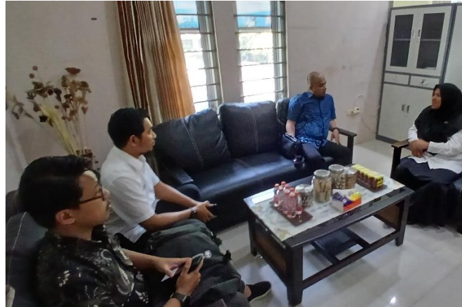
Gambar 6. Penyerahan Dan Pelaporan Hasil Evaluasi Pelaksanaan Tujuan Pembangunan Berkelanjutan Kabupaten Wajo