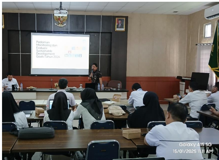
Gambar 3. Pelatihan dan Penguatan Kapasitas Bagi Pemerintah Daerah, Pelaku Usaha dan NGO Kabupaten Wajo

Pelatihan kemudian dilanjutkan dengan sesi workshop interaktif, di mana peserta dilibatkan secara langsung dalam praktik penyusunan alat monitoring dan evaluasi berbasis Logical Framework (Logframe) dan Balanced Scorecard . Pada pelaksanaan simulasi ini, peserta dari OPD mencoba menyusun rencana program dengan pendekatan logis yang mencakup tujuan, indikator, baseline, serta metode pengukuran. Pendekatan ini memperkenalkan paradigma baru dalam perencanaan dan pelaporan program pemerintah yang lebih terukur dan terarah. Selain itu, penggunaan Balanced Scorecard diperkenalkan sebagai alternatif kerangka kerja untuk mengukur capaian SDGs dengan dimensi kinerja yang lebih luas, termasuk aspek sosial, ekonomi, lingkungan, dan tata kelola. Peserta pelaku usaha diberikan ruang untuk menyelaraskan program CSR mereka dengan indikator SDGs, seperti kontribusi terhadap pendidikan, kesehatan, dan pemberdayaan ekonomi masyarakat. Untuk perwakilan NGO diberikan pemahaman tentang bagaimana menghubungkan kegiatan advokasi dan pemberdayaan masyarakat yang selama ini mereka jalankan dengan target SDGs, sehingga peran mereka menjadi lebih strategis dan terukur.