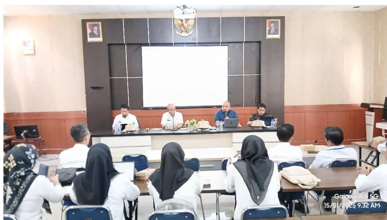
Gambar 2. Pembukaan dan Sambutan Oleh Kepala Bappeda Kabupaten Wajo

Kegiatan pengabdian kepada masyarakat yang dilaksanakan di Kabupaten Wajo yang dilaksanakan pada tanggal 15 Januari 2025 ini berhasil memberikan dampak positif dalam peningkatan pemahaman serta penguatan kapasitas pemerintah daerah, pelaku usaha, dan organisasi non-pemerintah (NGO) dalam upaya monitoring dan evaluasi pelaksanaan Sustainable Development Goals (SDGs). Pelaksanaan kegiatan dimulai dengan sesi pembukaan yang dihadiri oleh perwakilan Bappeda Kabupaten Wajo, perwakilan dari 9 OPD yaitu Dinas Lingkungan Hidup, Dinas Kesehatan, Dinas Sosial, Dinas Pendidikan, Dinas Ketenagakerjaan, Dinas Koperasi dan UMKM, Dinas Pemberdayaan dan Perlindungan Perempuan dan dinas terkait lainnya serta perwakilan perusahaan lokal dan NGO mitra pembangunan. Kegiatan ini diawali dengan penyampaian materi mengenai dasar-dasar SDGs, urgensi pelibatan multipihak dalam pembangunan berkelanjutan, dan pentingnya sistem monitoring dan evaluasi berbasis manajerial. Para peserta menunjukkan antusiasme yang tinggi dalam memahami hubungan antara peran kelembagaan mereka dan pencapaian target SDGs, khususnya dalam konteks lokal Kabupaten Wajo.