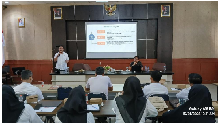
Gambar 4. Dialog Interaktif Pemerintah Daerah, Pelaku Usaha dan NGO Kabupaten Wajo

Secara umum, hasil kegiatan menunjukkan adanya peningkatan kapasitas dan kesadaran kolektif tentang pentingnya monitoring dan evaluasi dalam pencapaian SDGs. Evaluasi singkat pasca kegiatan menunjukkan bahwa lebih dari 85% peserta merasa pelatihan sangat bermanfaat, khususnya dalam memahami keterkaitan peran lembaga mereka dengan indikator SDGs. Peserta juga menyampaikan bahwa tools yang diperkenalkan cukup mudah diaplikasikan dalam konteks tugas mereka sehari-hari. Selain itu, Bappeda Kabupaten Wajo menyampaikan komitmen untuk mengintegrasikan modul dan tools monev yang dikembangkan dalam kegiatan ini ke dalam proses perencanaan dan pelaporan pembangunan daerah, khususnya dalam laporan capaian SDGs tingkat kabupaten sehingga kegiatan ini tidak hanya memberikan manfaat jangka pendek dalam bentuk peningkatan kapasitas, tetapi juga membuka jalan menuju kolaborasi pembangunan berkelanjutan yang lebih terstruktur dan terarah di Kabupaten Wajo.