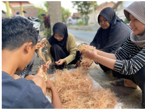
Gambar 1. Proses Pemilihan sabut kelapa

Spons sabut kelapa yang akan diproduksi memiliki nama Coco Spons, sebagai identitas bahwa spons tersebut terbuat dari bahan alami. Dalam pembuatan spons dari sabut kelapa perlu diperhatikan beberapa tahapan yang harus dilakukan, yaitu :