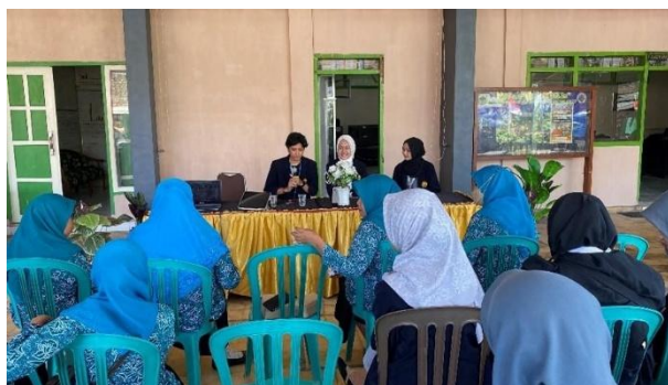
Gambar 3. Sosialisasi Coco Spons

Setelah tahapan pembuatan selesai dilanjutkan dengan melakukan sosialisasi kepada warga atau Ibu-Ibu Desa Gambangan di Balai Desa Gambangan. Sosialisasi dilakukan dengan menjelaskan secara singkat materi Coco Spons dan memperlihatkan video cara pembuatan Coco Spons, dan sosialisasi dilakukan selama kurang lebih 30 menit. Sosialisasi ini diharapkan mampu meningkatkan pemahaman dan keterampilan masyarakat dalam mengolah limbah sabut kelapa menjadi produk yang ramah lingkungan dan bernilai ekonomis. Warga mengikuti sosialisasi dengan antusias dan tertarik dengan produk Coco Spons.