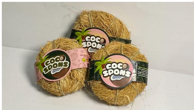
Gambar 2. Produk Coco Spons

Setelah tahapan pembuatan selesai dilanjutkan dengan melakukan sosialisasi kepada warga atau Ibu-Ibu Desa Gambangan di Balai Desa Gambangan. Sosialisasi dilakukan dengan menjelaskan secara singkat materi Coco Spons dan memperlihatkan video cara pembuatan Coco Spons, dan sosialisasi dilakukan selama kurang lebih 30 menit. Sosialisasi ini diharapkan mampu meningkatkan pemahaman dan keterampilan masyarakat dalam mengolah limbah sabut kelapa menjadi produk yang ramah lingkungan dan bernilai ekonomis. Warga mengikuti sosialisasi dengan antusias dan tertarik dengan produk Coco Spons.