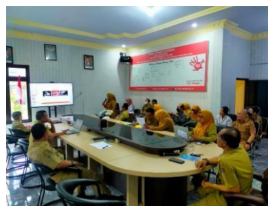
Gambar 4. Rapat Bagian Staff Dinas Mengenai Loss Dol DPMPTSP

Berikut rapat yang dilakukan oleh DPMPTSP Kabupaten Blitar mengenai inovasi LOSS DOL: