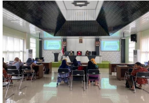
Gambar 3. Kegiatan Bimbingan Teknis oleh DPMPTSP

Adapun bentuk bimbingan teknis yang dilakukan oleh DPMPTSP Kabupaten Blitar kepada perwakilan/operator desa di Kabupaten Blitar sebagai berikut: