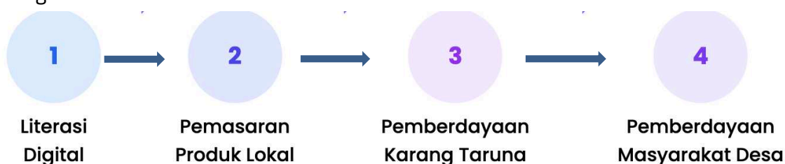
Gambar 1. Kerangka Pemikiran