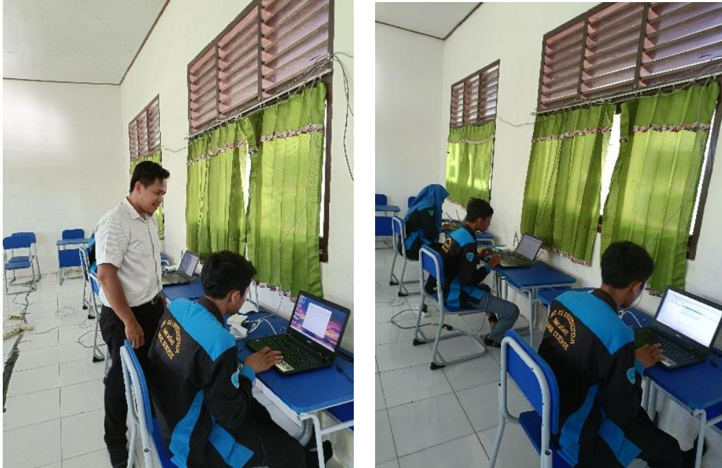
Gambar 3. Praktek konfigurasi mikrotik