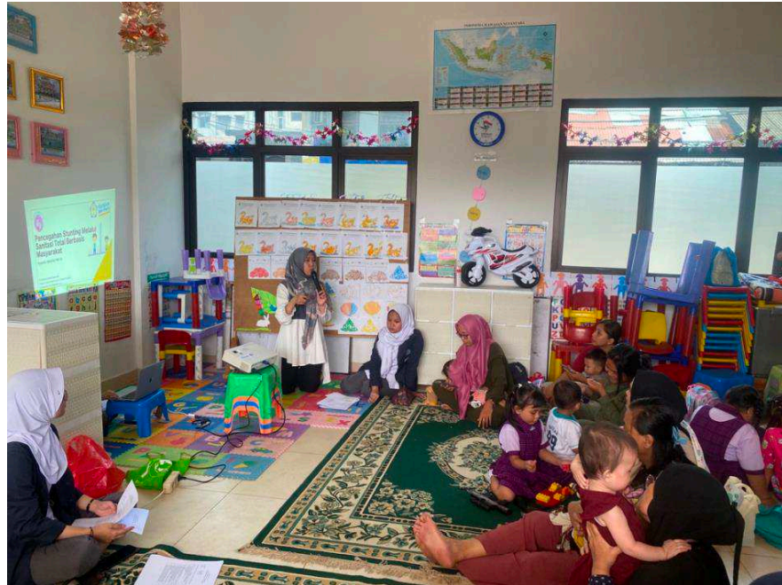
Gambar 1. Kegiatan pertama pengabdian masyarakat di Posyandu Mekar Sari RW 12 Karang Anyar