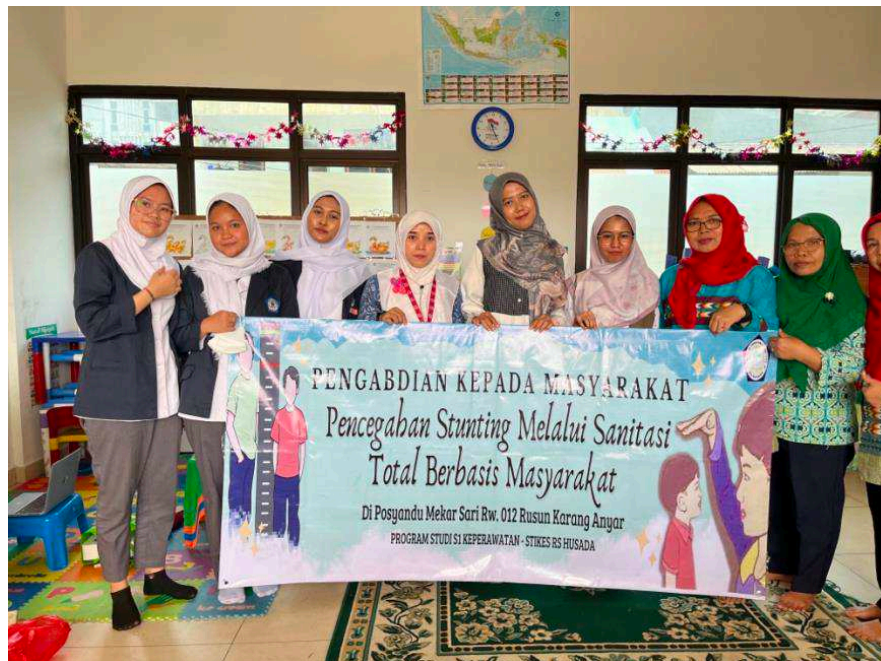
Gambar 2. Kegiatan kedua pengabdian di Posyandu Mekar Sari RW 12 Karang Anyar

Sebelumnya penerapan STBM ini banyak dampak yang dapat dirasakan manfaatnya sebelum akhirnya memiliki efek pada stunting . Program STBM memberikan dampak secara