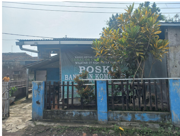
Gambar 2. Posko Bencana Gempa Bumi

Evakuasi menjadi prioritas utama, dan warga diarahkan untuk keluar dari rumah serta menempati tenda-tenda pengungsian yang disediakan. Meskipun sempat mengalami hambatan dalam distribusi tenda, pemerintah desa bersama BPBD (Badan Penanggulangan Bencana Daerah), relawan dari luar daerah, serta tokoh masyarakat saling membantu dalam melaksanakan evakuasi awal. Proses evakuasi dilakukan segera setelah terjadinya gempa, sebanyak kurang lebih 13 titik pengungsian dibuka untuk menampung warga terdampak.