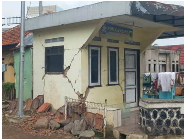
Gambar 1. Kerusakan Pos Kamling