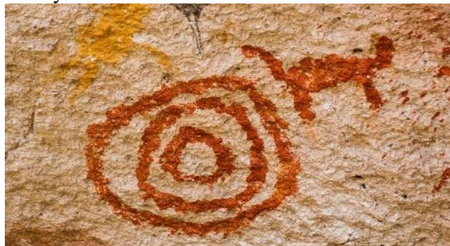
Gambar 4. Elemen lingkaran di sebuah gua prasejarah di Santa Cruz, Argentina

Bentuk dasar seperti lingkaran, digunakan untuk melambangkan sifat alam semesta yang tak terbatas dan mewakili nilai keabadian. Bentuk lingkaran telah lama menjadi sebuah simbol peradaban masa lalu dalam tulisan ideografik kuno yang ditemukan di gua-gua prasejarah seperti yang ditampilkan pada gambar 4. Terdapat lukisan lingkaran yang menggambarkan lingkaran kosong dan ada yang diberi titik di tengahnya. Lingkaran yang kosong menggambarkan mata atau mulut yang terbuka, sementara lingkaran dengan titik di tengahnya melambangkan matahari atau "mata" dari Penguasa Alam. Simbol lingkaran ini digunakan oleh hampir setiap peradaban budaya di seluruh dunia.