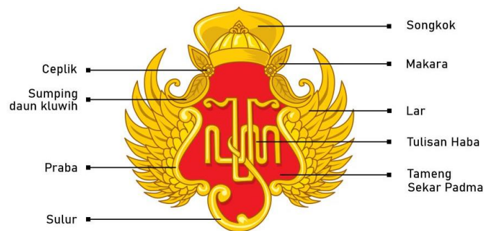
Gambar 2. Elemen-elemen visual yang menjadi unsur pembentuk lambang Keraton Yogyakarta

Bagian tengah lambang terdapat bidang berwarna merah. Sementara pada bagian tengah bidang warna merah terdapat huruf/aksara Jawa Murda atau kapital. Aksara tersebut berbunyi ha-ba (dibaca: ho-bo) yang merupakan singkatan dari Hamengku Buwana, mengacu pada gelar dari Sultan Keraton Yogyakarta. Sulus yang terjuntai ke bawah dari aksara ha-ba adalah aksara pasangan ma dalam aksara Jawa.