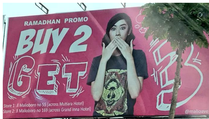
Gambar 1. Penggunaan ilustrasi dalam pada produk kaos yang mirip dengan lambang keraton Yogyakarta dalam publikasi di media luar ruang Sumber: https://twitter.com/GKRHayu/status/1013689296102948865

Topik penelitian tentang lambang keraton Yogyakarta ini berangkat dari adanya pemberitaan di media online twitter yang sempat menyita perhatian publik tentang persoalan penggunaan lambang keraton oleh masyarakat ternyata menuai kritik dari pemangku keraton Yogyakarta dan juga masyarakat itu sendiri. Gambar 1 menampilkan penggunaan ilustrasi dalam pada produk kaos yang mirip dengan lambang keraton Yogyakarta dalam publikasi di media luar ruang.