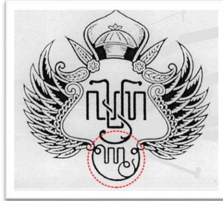
Gambar 7. Lambang Praja Cihna-Cihnaning Salira Pribadi dalam angka Jawa (lingkaran merah) yang menjadi gelar pribadi Sultan yang berkuasa.

Angka Jawa merupakan simbolisasi dari setiap Sultan yang berkuasa di Keraton Yogyakarta. Aksara Jawa ini menjadi wujud kebudayaan asli dan diri, serta kepribadian bangsa. Lambang Keraton Yogyakarta memiliki dua versi yaitu lambang untuk nagari (kerajaan) dengan sebutan Praja Cihna dan lambang untuk tanda gelar sultan yang sedang berkuasa dengan sebutan Praja Cihna-Cihnaning Pribadi . Lambang Praja Cihna-Cihnaning Salira Pribadi ditampilkan pada gambar 7.