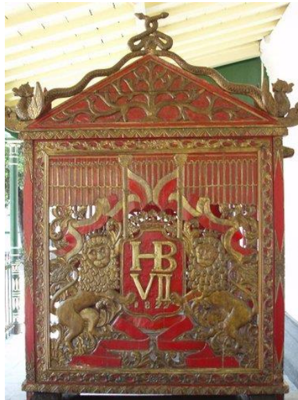
Gambar 5. Tandu Pengantin Sultan HB VII. Penggunaan huruf Romawi dan binatang singa

Sebelumnya, tampilan visual dari lambang Keraton Yogyakarta sebenarnya sangat dipengaruhi oleh bentuk mahkota dari kerajaan Belanda, dan ini tetap berlaku hingga masa pemerintahan Sri Sultan Hamengkubuwono VII, di mana lambang Keraton Yogyakarta tersebut masih digunakan sebagai elemen dekoratif pada perlengkapan kerajaan yang dimiliki oleh Sultan. Disamping penggunaan mahkota gaya Belanda, pada salah satu property istana juga perwujudan singa di bagian kiri dan kanan yang ditampilkan pada gambar 5. Citra visual tersebut menunjukkan kentalnya pengaruh Eropa pada produk estetika Keraton Yogyakarta.