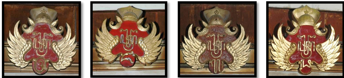
Gambar 8. Beberapa lambang yang digunakan oleh masing-masing Sultan Yogyakarta saat memerintah Keraton.