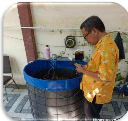
Gambar 5. Pengamatan kualitas air selama menyiapkan air media