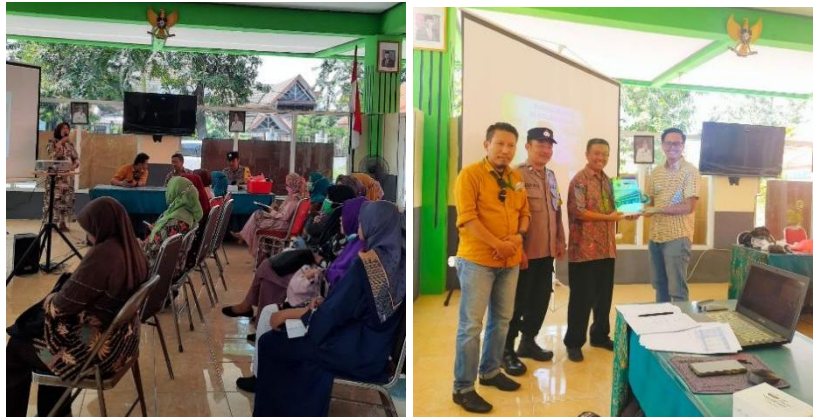
Gambar 3. Sambutan ketua kelompok tani dan pembukaan olej lurah Bendul merisi Surabaya

adalah Lingkungan rumah, Konstruksi rumah, Kebutuhan hawa di dalam rumah, Kebutuhan cahaya (Sri Hardianti, dkk., 2022). Dengan terbentuknya lingkungan rumah yang Sehat, Sejuk, Nyaman, maka tercipta lingkungan yang Bersih, Tertata dan Indah. Komoditas yang dikembangkan, menyesuaikan dengan apa yang ada pada lingkungan yang lahannya cenderung terbatas, antara lain bidang Perikanan (budidaya ikan lele) dan bidang Pertanian (budidaya hortikultura : terong, cabe, sawi, bayam, kangkung).