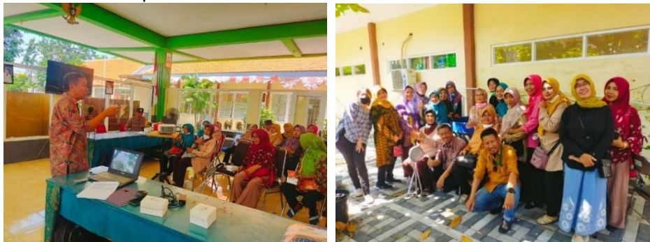
Gambar 4. Penyuluhan dan pelatihan penataan pekarangan dan penyiapan sistem bioflok pada budidaya lele di koprak bumilis

Materi penyuluhan berikutnya adalah cara menyiapkan media air budidaya sistem bioflok untuk mengurangi mortalitas benih lele di awal masa pemeliharaan. Kolam yang digunakan untuk praktek persiapan air budidaya menggunakan kolam terpal milik kelompok tani. Kolam terpal berbentuk bulat ukuran diameter 1 meter, tinggi kolam 1 meter. Kolam diisi air PDAM yang sudah diendapkan dalam tandon, dengan ketinggian air 0,9 meter. Benih lele dengan padat penebaran 100 ekor per kolam untuk pemula. Pada kegiatan pelatihan para peserta diajak praktek membuat media air budidaya dengan tema Pelatihan atau praktek penyiapan media dengan sistem bioflok pada pemeliharaan lele dalam Koprak Bumilis.