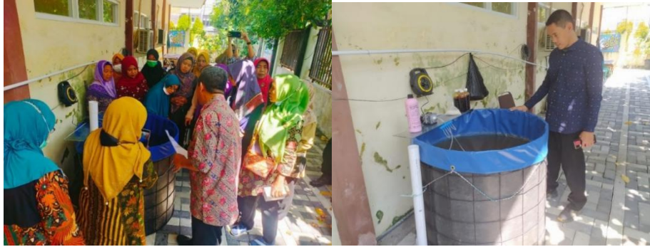
Gambar 2. Penjelasan tatacara memasukkan bahan baku bioflok ke dalam koprak bumulis

Tim pengusul : Memfasilitasi dan mendampingi serta membina mitra dari mulai awal hingga akhir program.