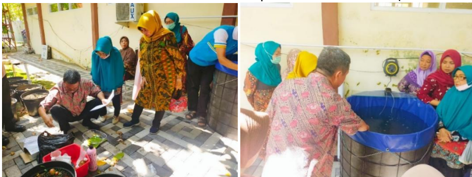
Gambar 1. Penimbangan bahan baku untuk pembuatan bioflok