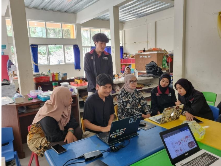
Gambar 2. Kegiatan Pelatihan Alat Kakas Desain

dengan antusiasme tinggi. Para peserta pelatihan mempelajari cara membuat berbagai materi pembelajaran yang lebih menarik dan efektif, seperti poster, flyer, serta materi promosi sekolah.