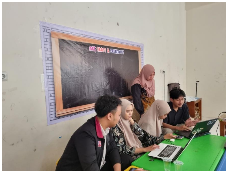
Gambar 3. Guru melakukan Praktik Pembuatan Desain

Kegiatan dimulai dengan pemaparan tentang teknologi alat kakas desain dan beberapa fitur yang ditawarkan serta cara efektif membuat desain poster atau konten lain untuk media sosial maupun keperluan pembelajaran pada gambar 2. Selain Alat kakas desain, tim pengabdian juga memberikan praktik tentang editing video menggunakan aplikasi Capcut pada gambar 3. Tim pengabdian memberikan materi tentang fitur-fitur dasar Capcut dan cara penggunaannya, diikuti dengan bimbingan praktik langsung kepada para guru untuk membuat video pembelajaran dan branding sekolah secara lebih efektif. Kegiatan pelatihan ini