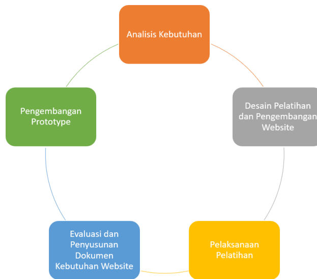
Gambar 1. Tahapan Pengabdian