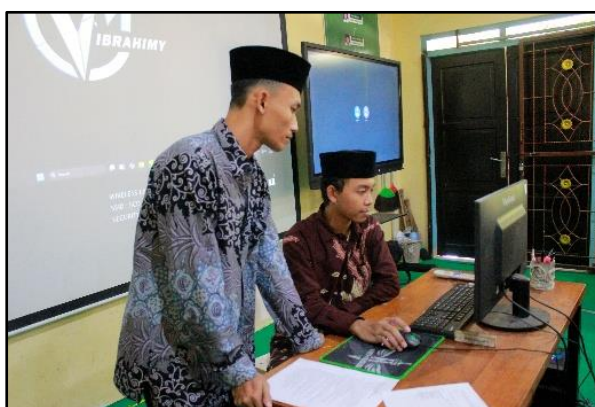
Gambar 1. Penyampaian Materi.

Sebagai bagian dari pemaparan materi, narasumber juga memperlihatkan simulasi sistem operasi melalui proyektor menggunakan VirtualBox . Dalam demonstrasi tersebut, siswa diperkenalkan pada perbedaan antarmuka dan fungsi dasar dari beberapa sistem operasi yang umum digunakan, seperti Windows , Linux , dan Android . Meskipun program ini bertujuan untuk memberikan gambaran praktis, siswa belum diberi kesempatan untuk mencoba langsung di perangkat masing-masing, karena keterbatasan fasilitas pribadi. Hal ini menjadikan program masih bersifat demonstratif dan belum sepenuhnya bersandar pada pengalaman praktik secara mandiri. Penyampaian materi sistem operasi oleh narasumber ditunjukkan oleh Gambar 1.