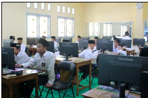
Gambar 2. Peserta yang Mengikuti Program.