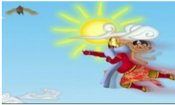
Gambar 13. Menceritakan Rahwana (sosok Bapa) membawa sinta (gadis muda) ke kahyangan untuk dinikahi pada menit ke 00:04:16.

Warna langit biru menjadi simbol dari kebenaran, kebaikan, keteguhan, dan kejujuran yang dicari raja. “Karena dihubungkan dengan langit, yakni tempat tinggi para dewa, surga, kahyangan, biru melambangkan keagungan, keyakinan, keteguhan iman..” (Sanyoto, 2009:49). Permainan warna bukan berarti permainan melawan warna satu dengan yang lainnya, tetapi menampilkan variasi warna yang berubah (Gadamer, 2005:104). Bapa yang digambarkan dalam karakter Rahwana telah mencapai titik kesempurnaan hidupnya, yaitu berhasil memperjuangkan cintanya dengan berbagai cara termasuk menculik Shinta (gadis muda) yang menjadi isteri keduanya hingga melakukan perlawanan terhadap burung Jatayu yang akan menyelamatkan Shinta. Hal ini sepadan dengan pendapat Jakob Sumardjo bahwa manusia jatuh ke atas, yakni menentang atau menyangkal kebenaran yang selama ini dianutnya, dan mulailah ia berjuang untuk menemukan “jalan ke atas” itu. Ketika ia jatuh, sebenarnya ia sedang naik, Paradoks (Jakob Sumardjo dalam Yudiaryani, 2017:3-4). Terlepas dari rasa keberatan keluarga baik itu dari anak dan isterinya, Bapa telah