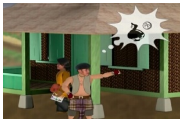
Gambar 7. Menceritakan rutinitas warga yang beradadi pekarangan rumah pada menit 00:01:48.