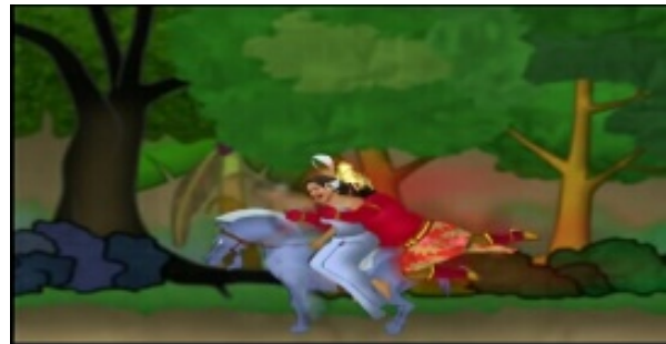
Gambar 12. Menceritakan Rahwana (sosok Bapa) menculik Sinta (gadis muda) di hutan pada menit ke 00:03:57

Karena birahi seorang raja tidak terbendung, akhirnya menculik gadis muda yang sedang dalam perjalanan