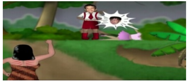
Gambar 5. Menceritakan kegiatan bermain anak-anak di pedesaan (mencuci pakaian) pada menit 00:00:56.

Dari gambar 4 dan 5, terlihat bahwa aktivitas warga sedang melakukan kegiatan rutinitas sehari-hari yaitu mencuci pakaian di pinggir sungai dan biasanya dilanjutkan dengan mandi di pinggir sungai terlihat dari pakaian samping yang dikenakan para gadis desa dalam video clip Tongtolang tersebut. Terlihat pula ada seorang anak yang sedang bermain air atau berenang di sungai tersebut, seperti anak desa pada umumnya di jaman dahulu. Dari gambar 4 terlihat bahwa ada seorang anak yang sedang menjahili sebayanya. Bisa saja yang dijahili tersebut adalah temannya atau bahkan saudara kandungnya. Karena dalam video clip tersebut terlihat seorang