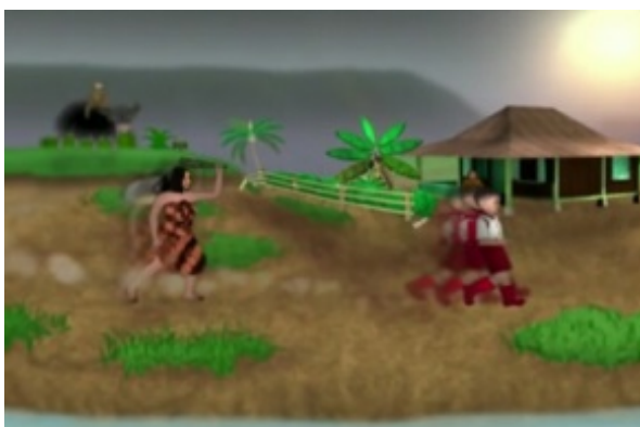
Gambar 6. Menceritakan rutinitas seorang ibu yang sedang menegur anaknya yang nakal pada menit 00:01:07.

wanita yang sedang menegur perbuatan anak yang jahil tersebut. Mungkin wanita itu adalah ibu dari anak yang jahil atau bahkan ibu tersebut merupakan orang tua dari anak yang dijahili. Di dalam adegan ini kreator ingin mengkomunikasikan rutinitas sehari-hari warga pedesaan melalui komunikasi visual. “Komunikasi visual adalah komunikasi yang menggunakan bahasa visual, dimana unsur dasar bahasa visual (yang menjadi kekuatan utama dalam penyampaian pesan) adalah segala sesuatu yang dapat dilihat dan dapat dipakai untuk menyampaikan arti, makna, atau pesan”. (Kusrianto, 2007:10).