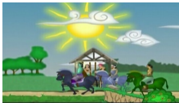
Gambar 8. Menceritakan rombongan Rama beserta Sinta (gadis muda) melewati pedesaan pada menit ke 00:02:14.

adalah celengan semar dalam meluapkan emosinya. Jadi dapat disimpulkan bahwa dalam adegan 3, 4, 5, dan 6 menjelaskan rutinitas kegiatan masyarakat di desa yang menganalogikan bahwa kawih kaulinan barudak Tongtolang merupakan kawih yang berasal dari desa sehingga digambarkan dalam adegan tersebut. Tetapi terdapat pesan moral yang disampaikan seperti pada lagu tongtolang, namun pesan moral di episode pertama ini adalah ketika anak sudah melenceng dari norma dan tatakrama, maka orang tua harus menegurnya agar tidak mengulangi perbuatan tersebut.