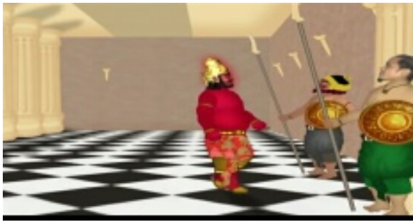
Gambar 9. Menceritakan Rahwana (sosok Bapa) akan menjumpai anak dan istrinya pada menit ke 00:02:34.