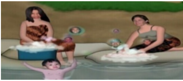
Gambar 4. Menceritakan rutinitas masyarakat di pedesaan (mencuci pakaian) pada menit 00:00:26.