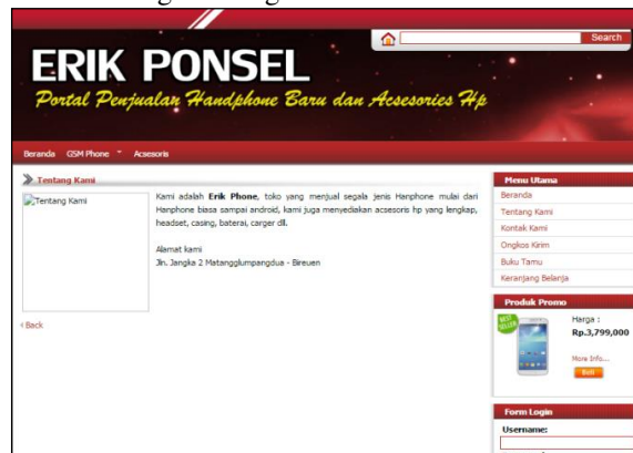
Gambar 4. Halaman Tentang

Halaman ini merupakan halaman yang menampilkan tentang profil Erik Oppo Smartphone Matanglumpungdua Bireuen. Sebagaimana gambar berikut :