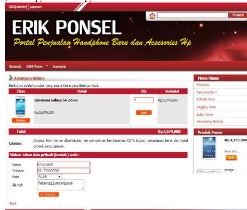
Gambar 7. Halaman Keranjang Belanja

Halaman ini merupakan halaman yang menampilkan keranjang belanja yang ditampilkan dalam tabel dengan jumlah total belanja, sebagaimana gambar berikut.