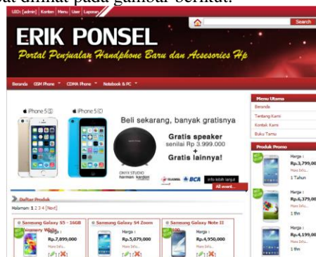
Gambar 9. Halaman Utama Admin

Halaman ini merupakan halaman utama admin. Pada halaman ini ditampilkan selamat datang admin, dan ada beberapa menu antara lain yaitu : menu tentang, menu konten, menu user, menu laporan dan menu logout . Untuk lebih jelas dapat dilihat pada gambar berikut.