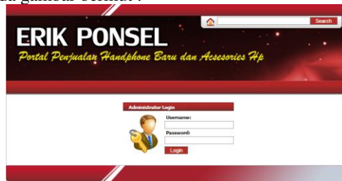
Gambar 8. Halaman Login Administrator

Halaman ini merupakan halaman login administrator untuk masuk ke dalam sistem dengan memasukkan username dan password , jika username dan password yang dimasukkan valid maka admin masuk ke sistem dan jika username dan password yang dimasukkan tidak valid maka admin harus login kembali. Untuk lebih jelas dapat dilihat pada gambar berikut :