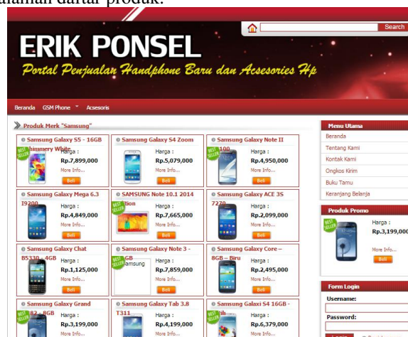
Gambar 5. Halaman Daftar Produk

Halaman ini merupakan halaman yang menampilkan daftar produk yang dijual di Erik Oppo Smartphone. Berikut ini tampilan halaman daftar produk.