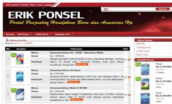
Gambar 11. Halaman Data Produk

Halaman ini merupakan halaman yang menampilkan data produk yang telah di input sebelumnya oleh admin. Pada halaman ini tersedia icon untuk menghapus dan mengedit data. Untuk lebih jelas dapat dilihat pada gambar berikut.