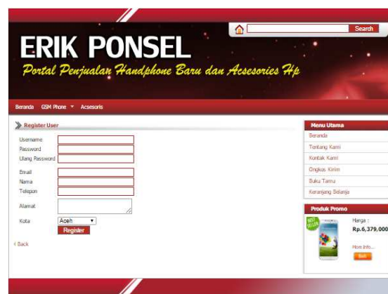
Gambar 6. Halaman Registrasi User

Halaman ini merupakan halaman yang berfungsi sebagai form registrasi user/pelanggan, pada halaman ini menampilkan sebuah form dengan beberapa field untuk isian data user. Berikut ini tampilan halaman registrasi user.