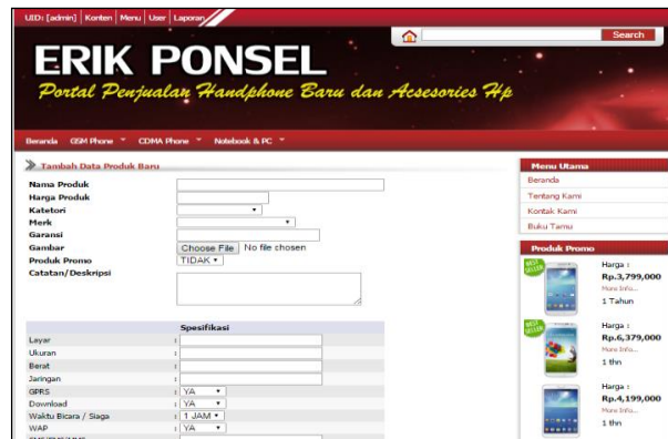
Gambar 10. Halaman Input Produk

Halaman ini merupakan halaman untuk proses input data produk yang di input admin setelah berhasil melakukan login . Pada halaman ini tersedia sebuah form input data dengan beberapa field . Untuk lebih jelas dapat dilihat pada gambar berikut.