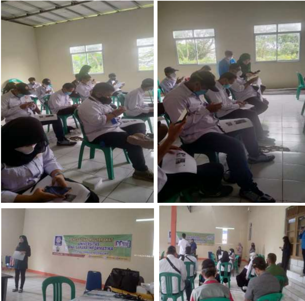
Gambar 1. Pelaksanaan Kegiatan Pelatihan Pengabdian Masyarakat

di Kantor Desa Kota Batu dengan yang dihadiri oleh peserta yaitu Karang Taruna Desa Kota Batu. Karang Taruna Desa Kota Batu mengalami kesulitan dalam melakukan pemasaran produk yaitu Masker 95. Metode pelaksanaan yang dilakukan adalah dengan memberika pelatihan pengelolaan media sosial dengan menggunakan aplikasi CANVAS. Media sosial yang digunakan disini adalah Instagram. CANVAS merupakan aplikasi mobile yang dapat dimanfaatkan untuk meningkatkan tampilan instagram.