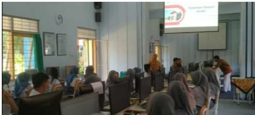
Gambar 6. Pembukaan PKM oleh Tim PKM

Dokumentasi kegiatan pelatihan pembuatan poster menggunakan coreldraw di SMAN 1 Talun dapat dilihat pada Gambar 6 sampai dengan Gambar 9.