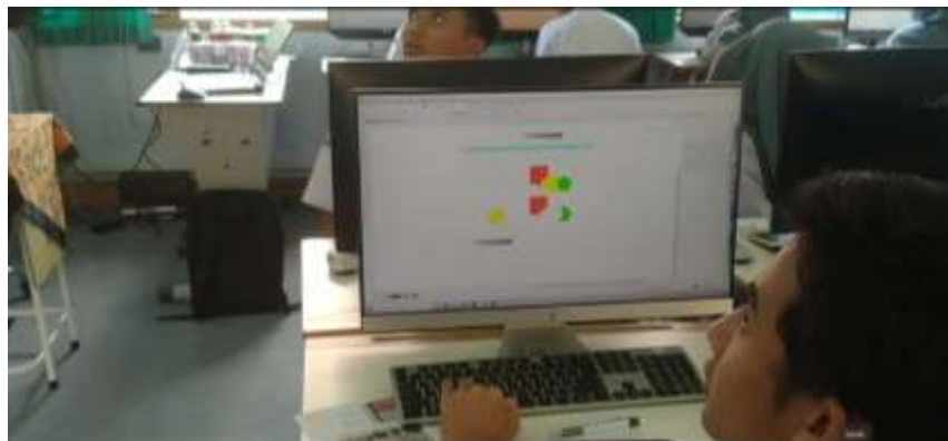
Gambar 8. Peserta Praktik tool dasar CorelDraw