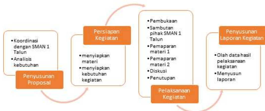
Gambar 1. Tahapan Kegiatan PKM

Kegiatan pelatihan pembuatan poster menggunakan coreldraw di SMAN 1 Talun dilakukan atas dasar kebutuhan siswa tentang desain grafis. Sebelum kegiatan dilaksanakan Tim PKM melakukan koordinasi dengan SMAN 1 Talun dalam rangka melakukan Analisa kebutuhan PKM. Selanjutnya dilakukan persiapan kegiatan berupa menyiapkan materi dan kebutuhan kegiatan pelatihan. Setelah persiapan selesai dilakukan, maka dilakukan pelaksanaan kegiatan PKM dan hasilnya dituangkan dalam laporan kegiatan PKM. Tahapan dari kegiatan PKM ini dapat dilihat pada Gambar 1.