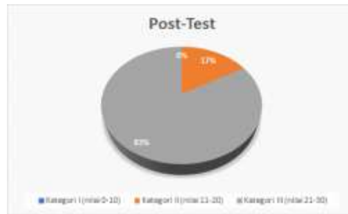
Gambar 5. Hasil post-test peserta PKM