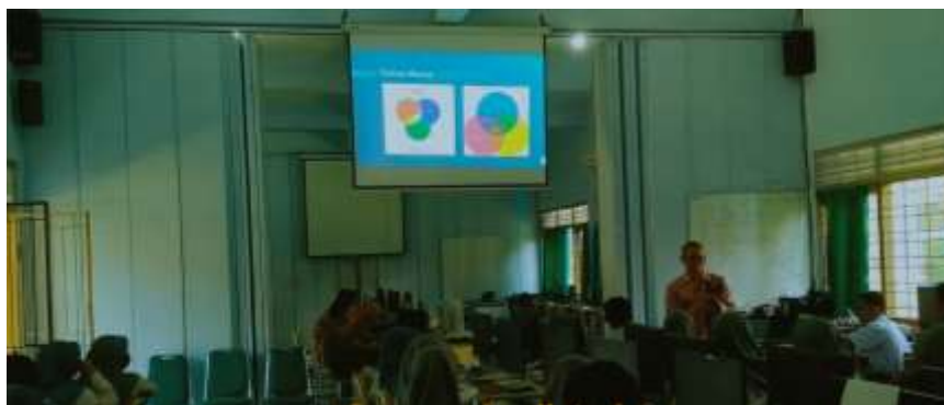
Gambar 2. Pemaparan materi 1

Kegiatan PKM ini dimulai dengan sambutan dari wakil kepala sekolah bidang kesiswaan yaitu Bapak Rifky Abror, S. Pd. Kemudian dilanjutkan dengan pemaparan materi 1 tentang prinsip desain dan psikologi warna oleh Heri Priya Waspada, MT (Gambar 2). Kemudian dilanjutkan pemaparan materi ke-2 yaitu desain poster dengan menggunakan CorelDraw oleh Ismanto, S.Pd, MT (Gambar 3).