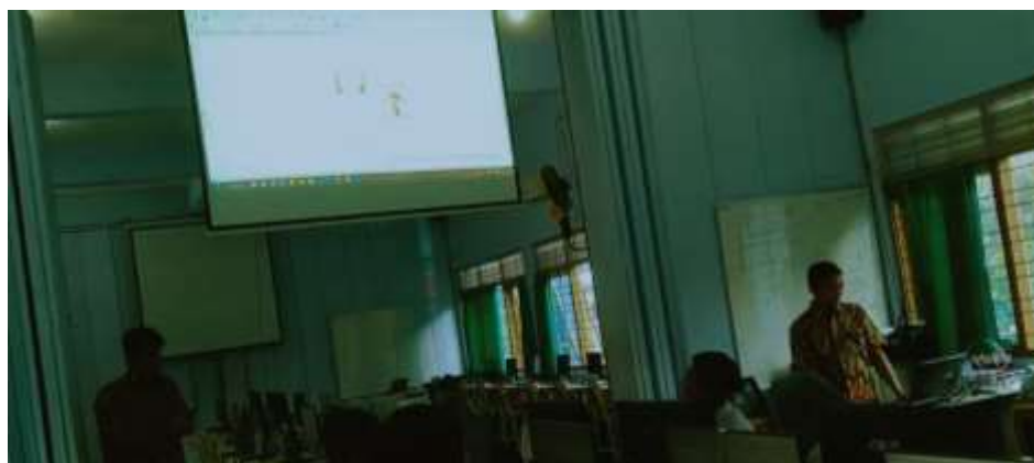
Gambar 3. Pemaparan materi 1