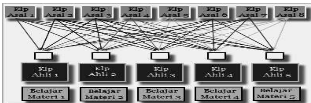
Gambar 2. Pembentukan Kelompok Jigsaw (modifikasi dari Tugino, 2013)