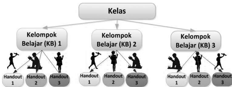
Gambar 1. Ilustrasi Kelompok Asal Jigsaw

Menurut Aronson dan rekan dalam Riyanto (2012), langkah-langkah penerapan metode Jigsaw bisa dibagi menjadi beberapa tahap berikut di antaranya adalah: Pertama , dibentuk kelompok belajar yang anggotanya disesuaikan dengan jumlah mahasiswa. Kedua , setiap mahasiswa yang menjadi anggota kelompok dibagikan materi yang berbeda. Langkah ketiga , dosen membagikan handout materi yang berbeda. Sementara itu kelompok lainnya juga mendapat tugas dan materi yang sama. Selanjutnya, mahasiswa yang menguasai materi A misalnya akan berkelompok lagi dengan mahasiswa dari kelompok lainnya yang menguasai materi A juga. Setelah selesai maka mahasiswa yang ahli materi A bertanggung jawab menyampaikan materi tersebut ke anggota