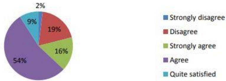
Gambar 3: Kemudahan Menerima Materi Pelajaran

Gambar 3 menunjukkan bahwa 2% menjawab sangat tidak setuju, 19% tidak setuju, 16% sangat setuju, 9% cukup puas, dan 54% responden menjawab setuju pada kuesioner yang menyatakan bahwa banyak sumber materi tersedia dengan metode asynchronous. Apa artinya? Artinya, siswa sudah mulai nyaman dengan mencari materi terhadap mata pelajaran tertentu. Mereka dapat memperoleh banyak sumber di platform lain seperti; Jurnal, Web, Buku, dll.