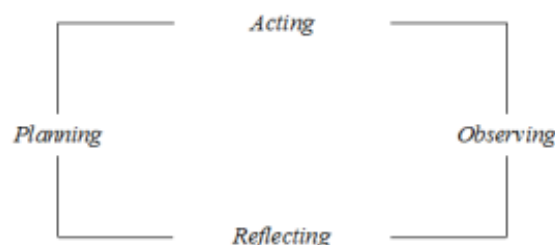
Gambar 1. Siklus Ptk Menurut Kurt Lewin

Penelitian ini dilakukan di RA Al Huda yang berlokasi di Jalan. S. Alimuddin Gang. Perintis RT. 19 Kel. Selili, Kec. Samarinda Ilir, Kota Samarinda. Penelitian ini bersifat Tindakan Kelas yang mengadopsi metode kombinasi kuantitatif dan kualitatif. Dalam hal pengumpulan data, penelitian ini digunakan melalui teknik observasi dan wawancara. Fokus pada hal yang diteliti ini adalah upaya untuk meningkatkan minat belajar anak melalui penerapan kartu bergambar pada kelompok B6 di RA Al Huda Samarinda. Penelitian ini melibatkan proses penyelidikan terkait efektivitas metode pembelajaran tersebut dalam merangsang minat belajar anak, dengan mengacu pada kerangka kerja yang dikemukakan oleh Ani (2008: 1).