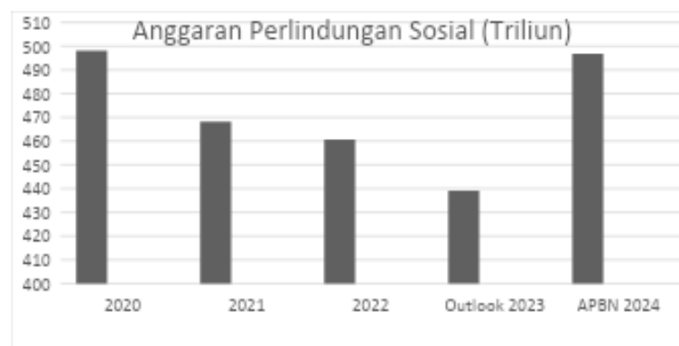
Gambar 1. Anggaran Perlindungan Sosial Tahun 2020-2024