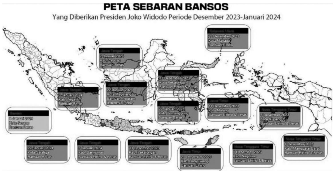
Gambar 3. Peta Persebaran Penyaluran Bansos Jokowi Periode Desember 2023 – Januari 2024