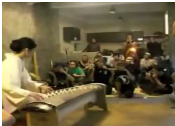
Gambar 6 Kolaborasi Karinding dengan Koto dari Jepang

1. Keterbukaan terhadap pengalaman Keterbukaan Abah Olot terhadap Pengalaman digambarkan oleh sifat fleksibelnya Abah Olot terhadap pengalaman baru dan tidak termakan zaman, tidak mengubah sisi original karinding namun mampu mengembangkan karinding dengan cara mengkolaborasikan alat musik karinding dan celempung. Halter sebut membuat karinding kembali mendapatkan daya tariknya dimasyarakat. Bergaulnya Abah Olot dengan komunitas Common Room yang didalamnya beranggotakan seniman dan pemuda kreatif Bandung, membuka pintu harapan karinding dan dirinya untuk dapat dikenal dalam komunitas musik metal Ujungberung yang berisikan pemusik-pemusik dengan aliran musik underground dan death metal . Abah Olot mulai berbagi ilmu pada mereka tentang karinding sehingga membuka kesempatan lahirnya persepsi baru dimana karinding dapat dimainkan dan dikolaborasikan tidak hanya dengan alat musik buhun lainnya, tetapi juga dapat dimainkan dengan alat-alat musik dan dalam aliran musik yang modern. Bahkan pada suatu kesempatan