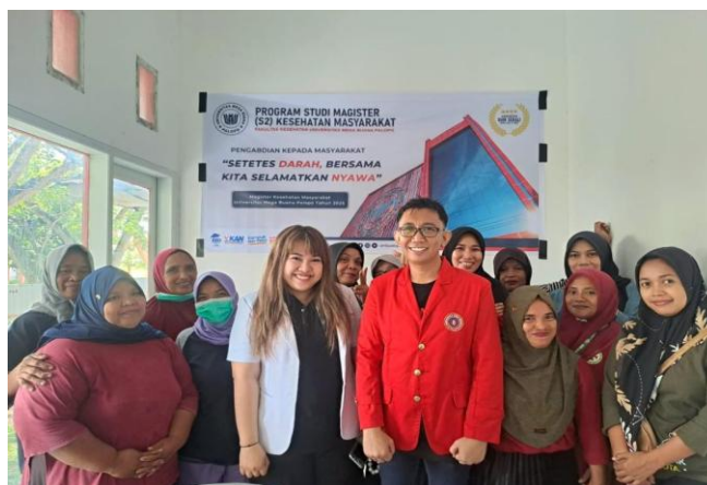
Gambar 2. Kegiatan Penyuluhan Manfaat donor darah dan edukasi interaktif

dalam diskusi kelompok sangat aktif, dengan respon positif terhadap materi edukasi yang diberikan. Meski demikian, beberapa peserta masih membutuhkan pendampingan lanjutan untuk mengatasi kekhawatiran dan hambatan personal terkait donor darah. Sejalan dengan temuan tersebut, penelitian di PMI Kota Tangerang mengonfirmasi bahwa motivasi utama pendonor sukarela adalah altruism/kemanusiaan dan kepedulian personal, serta keyakinan terhadap manfaat kesehatan setelah donor (Narulita, A., Susanti, MM, Wulansari, C. R., & Intansari, 2020).