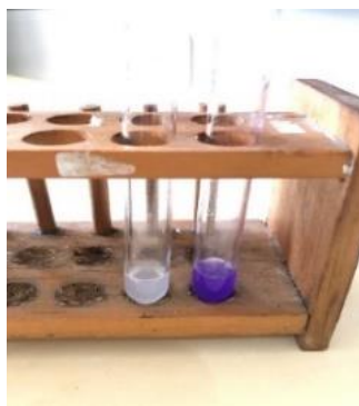
Gambar 2. Hasil Uji Validasi Kit Formalin

Hasil validasi kit dengan formalin didapatkan sampel positif berubah warna menjadi violet (ungu), hal ini disebabkan karena adanya kondensasi senyawa fenolik dengan formaldehida sehingga warna sampel berubah menjadi ungu.