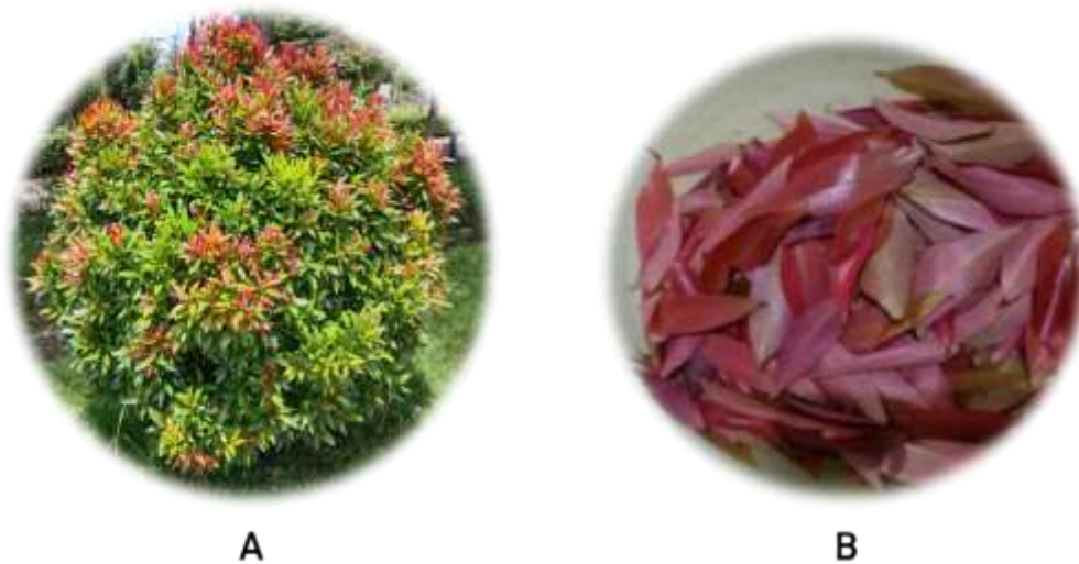
Gambar 1. Tumbuhan Daun Pucuk Merah (A) (Dokumentasi Pribadi, 2026) dan Daun Pucuk Merah (Nofita & Rahman, 2025)

et al., 2025). Perubahan warna pada daun pucuk merah berkaitan dengan warna pigmen yang terkandung di dalamnya. Antosianin bertanggung jawab atas warna merah pada daun pucuk merah muda, dan daun pucuk merah tua didominasi oleh klorofil, sehingga warnanya berubah menjadi hijau (Purbajati et al., 2025). Daun pucuk merah memiliki morfologi yang khas dibandingkan dengan daun dari genus Syzygium lainnya, seperti daun cengkeh ( Syzygium aromaticum ), daun juwet ( Syzygium cumini ), daun salam ( Syzygium polyanthum ), daun jambu air ( Syzygium aqueum ), dan daun jambu darsono ( Syzygium malaccense ). Perbandingan morfologi daun pucuk merah dengan daun lain dari genus Syzygium lainnya ditampilkan pada Tabel 1 . Umumnya, daun pucuk merah secara tradisional telah dimanfaatkan untuk mengobati sakit perut (Kusriani et al., 2019). Kenampakan tumbuhan pucuk merah dan daun pucuk merah ditampilkan pada Gambar 1 , dan kenampakan morfologi daun lain dari genus Syzygium ditampilkan pada Gambar 2 .