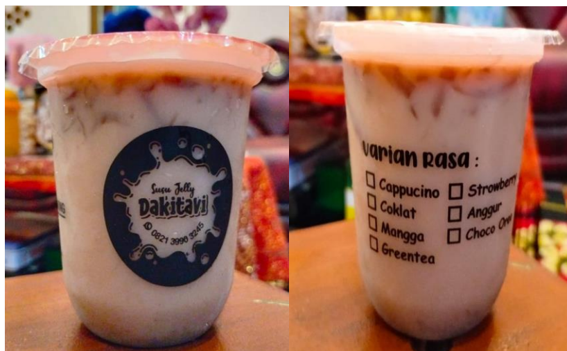
Gambar 2: Rencana Kemasan Cup Produk Dengan Label