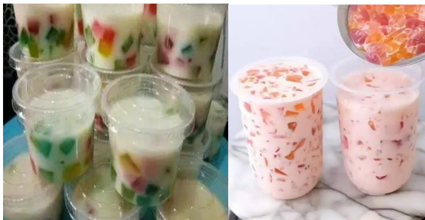
Gambar 1. Kemasan Cup Awal Produk Susu Jelly Tanpa Label