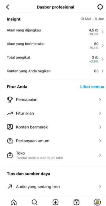
Gambar 4. Insight akun Instagram Talamcutabang.

Intensitas merujuk kepada seberapa sering sebuah iklan dilihat oleh konsumen. Intensitas iklan yang tinggi dapat diukur dari beberapa faktor seperti suara yang jelas, audio yang bersih, dan juga kualitas video yang baik tentunya. Dari hasil wawancara yang dilakukan, terlihat bahwa konsumen tertarik dengan konten yang diunggah oleh Talamcutabang. Hal ini disebabkan oleh jenis konten yang berbeda dari produk lain, serta interaksi yang terjalin antara Talamcutabang dan konsumen yang semakin meningkatkan intensitas iklan. Selain itu, ciri khas di setiap konten promosi yang digunakan Talamcutabang, seperti warna kuning dan hijau menjadi ciri khas yang di ingat oleh konsumennya. Hal ini bisa di lihat dari contoh gambaran insight akun Talamcutabang: