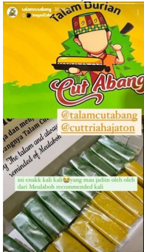
Gambar 1. Repost story akun Instagram Talamcutabang dari konsumennya

“Kalau like ada, tapi kalau komen tidak pernah. Kalau share produk Talamcutabang di akun sendiri pernah, tapi bukan share konten yang dibuat langsung oleh Talamcutabang, buat sendiri lalu posting di akun pribadi” (Mauliza, 21 Mei 2024).