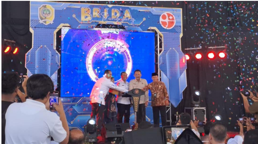
Gambar 1 Gebyar INOTEK Tulungagung 2024

Pelaksanaan Gebyar Inovasi dan Teknologi Kabupaten Tulungagung 2024 dibagi menjadi tiga jenis inovasi yaitu; pelayanan publik, kesehatan, serta masyarakat dan pendidikan. Adapun tahapan pada pelaksanaannya terbagi menjadi 5 tahapan sebagaimana tertera dalam gambar 4.6