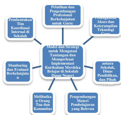
Gambar 3. Strategi Terintegrasi dan Berkelanjutan dalam Implementasi Kurikulum Merdeka Belajar di Sekolah Dasar Negeri

Implementasi Kurikulum Merdeka Belajar di Sekolah Dasar Negeri (SDN) memerlukan pendekatan yang terintegrasi dan berkelanjutan untuk mengatasi tantangan dan memperkuat peluang implementasi (Mustoip, 2023). Strategi yang diterapkan mencakup pelatihan dan pengembangan profesional berkelanjutan bagi guru, yang melibatkan konsep, metodologi, dan strategi pembelajaran sesuai dengan pendekatan KMB (Poch et al., 2023). Selain itu, peningkatan akses dan keterampilan teknologi guru menjadi prioritas, dengan upaya untuk menyediakan infrastruktur IT yang memadai di sekolah dan memastikan guru memiliki keterampilan yang cukup untuk mengintegrasikan teknologi dalam pembelajaran (Arum, 2023). Kolaborasi yang erat antara sekolah, Dinas Pendidikan, orang tua, dan masyarakat lokal juga menjadi kunci sukses, dengan penyelenggaraan lokakarya, seminar, dan pertemuan rutin sebagai wadah untuk berbagi pengalaman dan merencanakan langkah-langkah strategis bersama (Ismail & Busa, 2023).