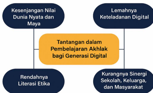
Gambar 1. Infografis Tantangan Pembelajaran Akhlak

Tantangan terakhir adalah kurangnya pelatihan dan dukungan sistematis untuk guru dalam pendidikan karakter berbasis digital. Banyak guru ingin mengembangkan pembelajaran akhlak yang relevan, namun terkendala oleh beban administrasi, minimnya pelatihan, serta keterbatasan sumber daya. Oleh karena itu, institusi pendidikan dan pemerintah perlu menyediakan pelatihan berkelanjutan tentang pembelajaran karakter yang kontekstual, integratif, dan berbasis teknologi. Investasi pada penguatan kapasitas guru dalam hal ini merupakan langkah strategis untuk memastikan bahwa pendidikan akhlak dapat menjawab tuntutan zaman.