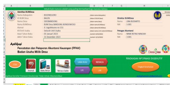
Gambar 5. Tampilan aplikasi akuntansi berbasis excel karya Andy P. Hamzah, Dosen PKN STAN

Guna melengkapi penyusunan laporan keuangan, tim menyarankan setiap unit usaha membuat daftar aset tetap yang menjadi tanggung jawab setiap unit. Daftar aset tetap dari masing-masing unit usaha ini nantinya digabungkan menjadi daftar aset tetap BUMDes Babo. Khusus pada unit usaha simpan pinjam (pembiayaan), tim menyarankan agar dibuat daftar peminjam (debitur); pada unit usaha layanan PAM, agar dibuat daftar pelanggan; dan pada unit usaha layanan pasar, agar dibuat daftar penyewa.