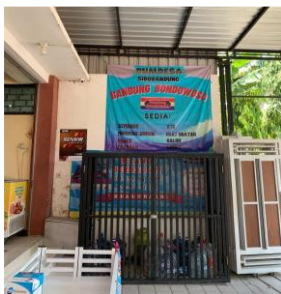
Gambar 2. Minimarket BUMDes Babo

Saat ini BUMDes Babo telah memiliki 5 (lima) unit usaha, yaitu: Minimart (perdagangan keperluan pokok dan rumah tangga) (Gambar 2), Wisata Air (wisata) (Gambar 3), Simpan Pinjam (Pembiayaan), Pengelolaan Pasar Tradisional, dan Jasa pengelolaan Air Bersih. Unit usaha ini bukan merupakan entitas yang terpisah dari BUMDes. Dengan demikian, entitas pada BUMDes Babo hanya satu, yaitu BUMDes itu sendiri.