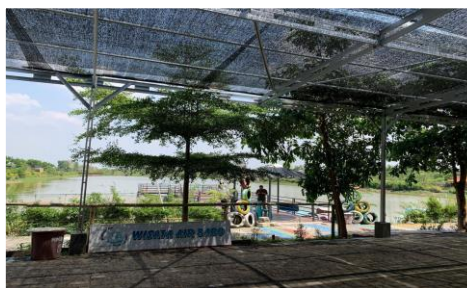
Gambar 3. Wisata Air BUMDes Babo

Sayangnya, keberhasilan demi keberhasilan yang telah dicapai oleh BUMDes Babo belum didukung oleh SDM yang memadai dalam bidang akuntansi dan perpajakan. Baik pimpinan ataupun staf BUMDes tidak ada yang memiliki latar belakang yang memadai di bidang tersebut. Namun demikian, harus diakui bahwa semangat dan etos kerja pimpinan dan staf BUMDes Babo sangat tinggi. Hal ini tampak dari keseriusan mereka untuk dapat menghasilkan laporan keuangan yang siap audit ( auditable ) dan bahkan keinginan untuk menjadi BUMDes patuh pajak.