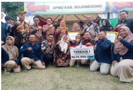
Gambar 1. Penganugerahan BUMDes terbaik tahun 2023 oleh Gubernur Jawa Timur

Pada tahun 2017, Desa Sidobandung membentuk sebuah unit usaha simpan pinjam (pembiayaan) sebagai upaya menggerakkan ekonomi masyarakat desa. Dengan berbekal kegiatan inventarisasi potensi desa dan peta aset desa melalui forum musyawarah desa, Kepala Desa dan tokoh masyarakat Desa Sidobandung akhirnya menyepakati pembentukan BUMDes. BUMDes ini kemudian diberi nama BUMDes Bandung Bondowoso (BUMDes Babo) dengan visi, "Meningkatkan Pendapatan Asli Desa Menuju Warga Sejahtera". Selanjutnya, pihak pengurus terpilih mengembangkan berbagai usaha yang berpotensi memberikan pemasukan bagi BUMDes. Pada tahun 2021, berasal dari pemupukan modal usaha jasa pembiayaan, minimart (Gambar 2), BUMDes Babo mengembangkan kegiatan usaha berupa wahana dalam wisata air (Gambar 3), dan unit simpan pinjam (pembiayaan).