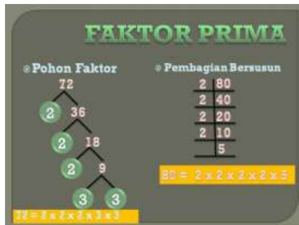
Gambar 2 Materi Faktor Prima

Keaktifan siswa juga menjadi salah satu variabel yang diukur dalam penelitian ini, karena aktivitas siswa juga dapat mempengaruhi hasil belajar. Untuk mengetahui keaktifan siswa dilakukan dengan menggunakan lembar observasi yang dilakukan pada saat pembelajaran Matematika melalui pendekatan scientific dengan pembelajaran cooperative learning berlangsung.