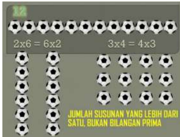
Gambar 1 Materi Bilangan Prima

dilakukan oleh Yuni Karsih Asmi Universitas Sebelas Maret yang mendapatkan hasil pada penerapan model pembelajaran kooperatif teknik Make a Match dengan pendekatan Scientific dapat meningkatkan pemahaman konsep menyederhanakan pecahan pada siswa kelas IV SDN Ponowaren 02. Berikut animasi yang ditampilkan saat pembelajaran berlangsung: