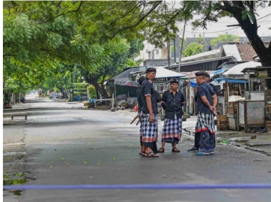
Gambar 2 Komunikasi tradisional Para pencalang

mencerminkan keberlangsungan nilai-nilai kultural dan spiritual yang diwariskan lintas generasi. Komunikasi yang berlangsung tidak hanya bersifat informatif, tetapi juga sarat makna simbolik dan ritualistik, yang membentuk serta memperkuat identitas keagamaan dan sosial masyarakat Hindu di Lombok.