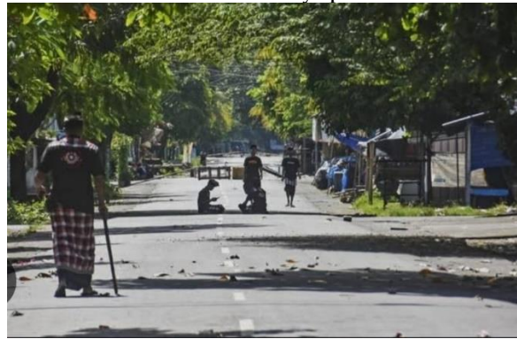
Gambar 1 Suasana Catur Brata Penyepian di Lombok

wilayah Mataram dan Lombok Utara, menjalankan ritual ini dengan kekhusyukan dan semangat kebersamaan yang tinggi. Melasti biasanya dilakukan di pantai-pantai seperti Pantai Ampenan, Pantai Senggigi, atau Pantai Tanjung, sebagai simbol pembersihan alam semesta dan diri. Tawur Kesanga dilaksanakan sehari sebelum Nyepi dengan pengorbanan simbolis kepada Bhuta Kala melalui prosesi ogoh-ogoh yang kini mendapat perhatian masyarakat luas. Saat Hari Nyepi, umat Hindu menjalankan Catur Brata Penyepian: amati geni (tidak menyalakan api), amati karya (tidak bekerja), amati lelungan (tidak bepergian), dan amati lelungan (tidak bersenang-senang). Pada hari berikutnya, umat Hindu melakukan Ngembak Geni, yaitu momen saling maaf dan memulai kehidupan baru yang lebih bersih dan harmonis. Berikut dokumentasi Hari Raya Nyepi di Lombok.