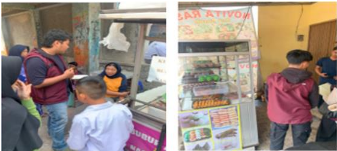
Gambar 3: Proses Pendampingan Sertifikasi Halal UMKM

produk. Untuk pembuatan Nomor Induk Berusaha (NIB) didampingi oleh Alhidayatullah, S.M., M.M., dan dibantu oleh Mahasiswa dalam proses pembuatannya. Sedangkan proses pengajuan sertifikasi halal self-declare ke akun ptsp.halal.go.id dibantu oleh mahasiswa yang didampingi secara langsung oleh pendamping halal.