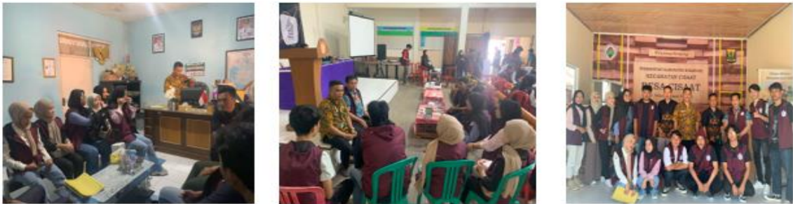
Gambar 2: Koordinasi Akhir Pelaksanaan Kegiatan Pendampingan

dan sertifikat halal pada tanggal 20 Juli 2023 dapat dilihat pada Gambar 2.