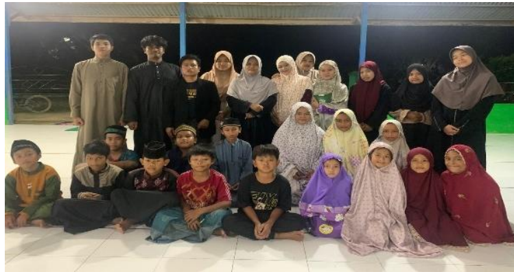
Gambar 2. Dokumentasi Pengelola TPA, Ustazah dan Santri Pasca Kegiatan

Secara sosial, hasil kegiatan menunjukkan terbangunnya kesadaran kolektif masyarakat terhadap pentingnya pendidikan Al-Qur'an bagi anak-anak. Dukungan orang tua dan pengurus TPA terhadap keberlangsungan kegiatan semakin meningkat, yang tercermin dari meningkatnya kehadiran santri dan keterlibatan masyarakat dalam mendukung aktivitas TPA. Dengan demikian, kegiatan PKM ini tidak hanya menghasilkan perubahan pada individu santri, tetapi juga mendorong terbentuknya iklim sosial yang lebih peduli terhadap penguatan pendidikan keagamaan di Desa Persiapan Jabdan.