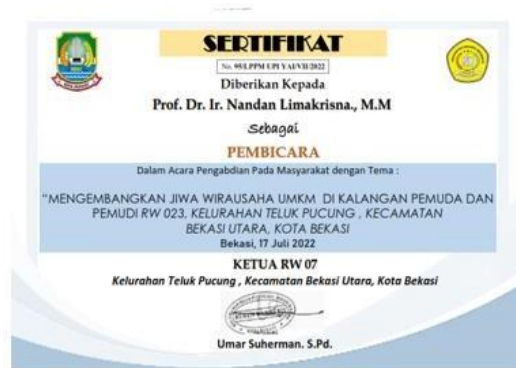
Gambar 5 : Sertifikat Narsum