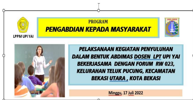
Gambar 2: Spanduk Kegiatan