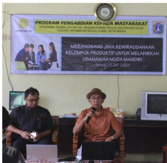
Gambar 4. Foto-Foto Suasana Penyuluhan