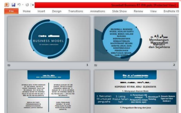
Gambar 3. Makalah Narsum