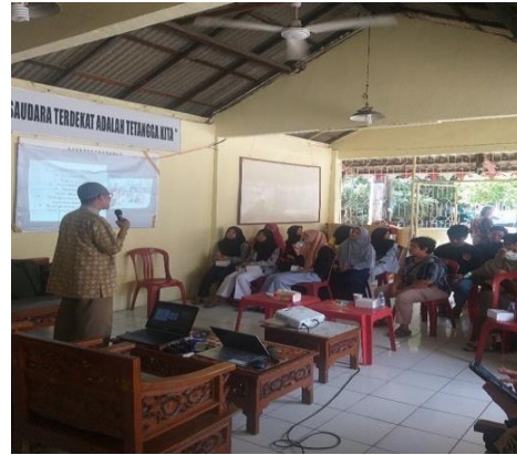
Gambar 1 : Acara Penyuluhan

Peserta Penyuluhan Adalah Pengurus Dan Warga RW 023, Kelurahan Teluk Pucung , Kecamatan Bekasi Utara, Kota Bekasi