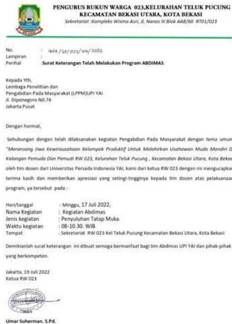
Gambar 6. Surat Dukungan Mitra